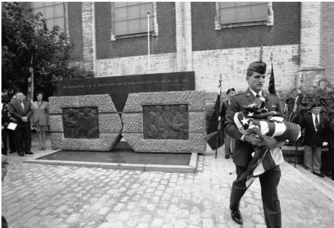
Het nieuwe oorlogsmonument wordt ingehuldigd

ORDE VAN DE BROUWER MET KERMIS – De Orde van de Brouwer gaat op de ingeslagen weg verder met de orga-