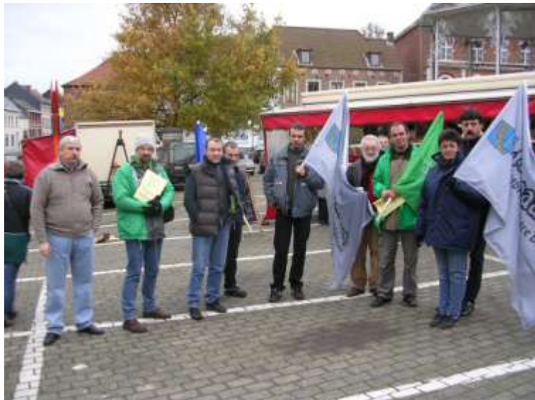
Actie tegen de sluiting op de zaterdagmarkt

In de cafés reageert men met verslagenheid. Heel wat mensen beweren dat ze geen Witte meer zullen drinken als hij buiten Hoegaarden gebrouwen wordt. Er komt ook een speciale gemeenteraad bijeen, om het probleem te bespreken. Er wordt een brief gestuurd naar de bestuursraad en directieraad van InBev met de vraag de werkgelegenheid en de productie-eenheid in Hoegaarden te behouden. De diverse politieke fracties uit de gemeenteraad