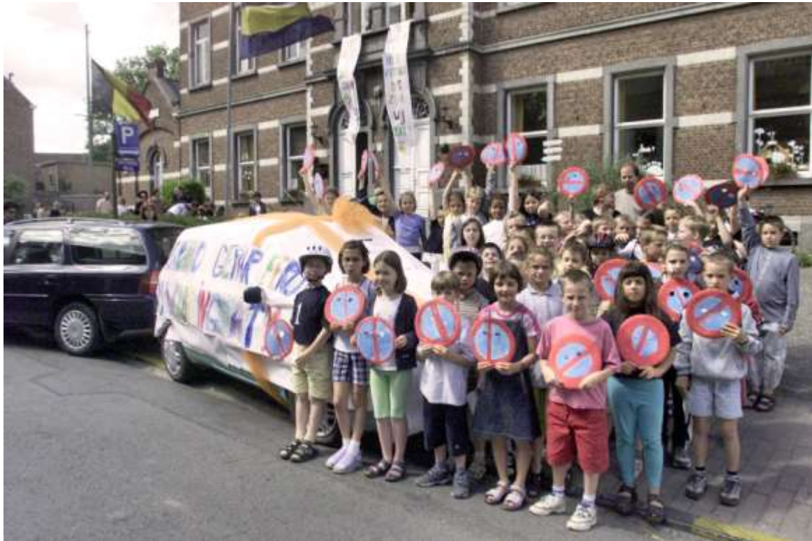
Protest tegen wildparkeren in de Doelstraat

op een oud gebruik dat omstreeks 1875 ophield te bestaan. Wat precies de Grietmuil was die de Bostenaren elk jaar begroeven is nog altijd niet geweten.