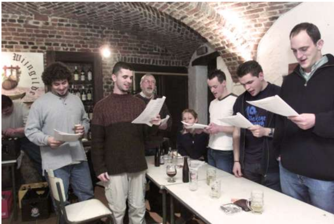
De jaarlijkse cantus in 't Paenhuys doet terugdenken aan Getegalm