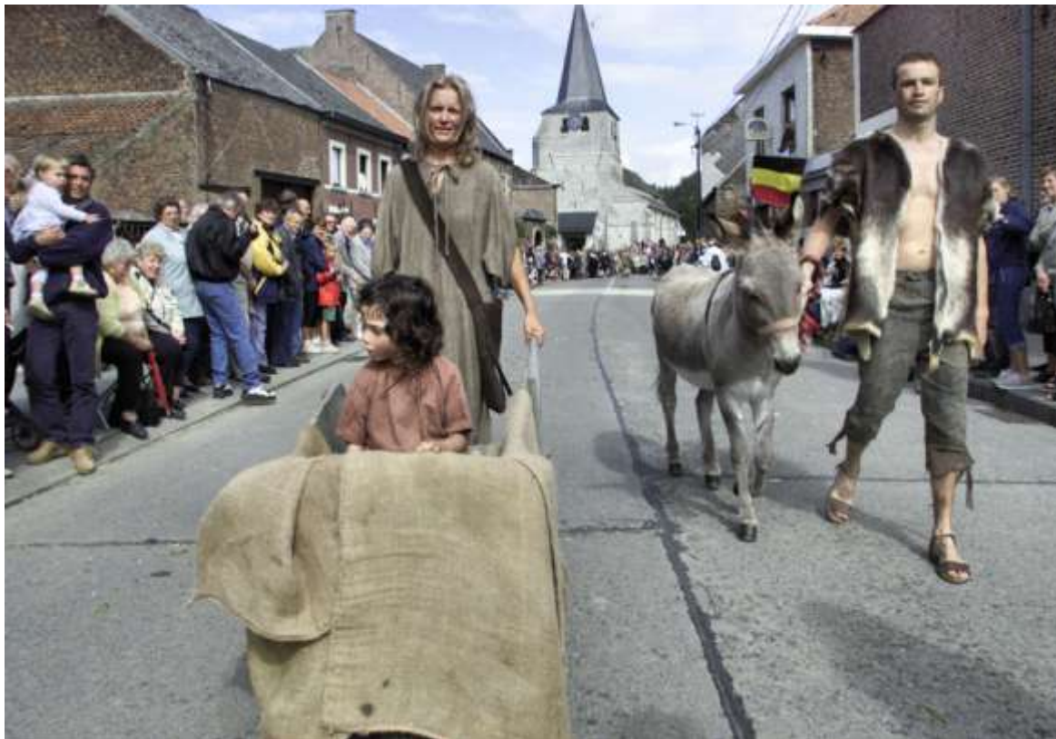
De Sint-Ermelindisommegang in de straten van Meldert

VERWARRING DOOR GEWIJZIGDE VERKEERSSITUATIE – Op de invalsweg naar de E40 is door de HST-werken, ter hoogte van Rommersom de verkeerssituatie weer danig gewijzigd. De mees-