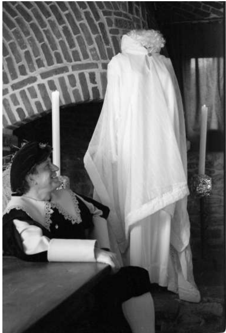
Op zoek naar de geest van de Witte Dame

DAS OP NUMMER DRIE – De Hoegaerdse Das is al nummer drie in de speciaalbieren op de Nederlandse markt. Niet slecht voor een bier dat pas op 1 januari 1997 in Nederland werd geïntroduceerd. Er werden al één miljoen sixpacks in Nederland verkocht.