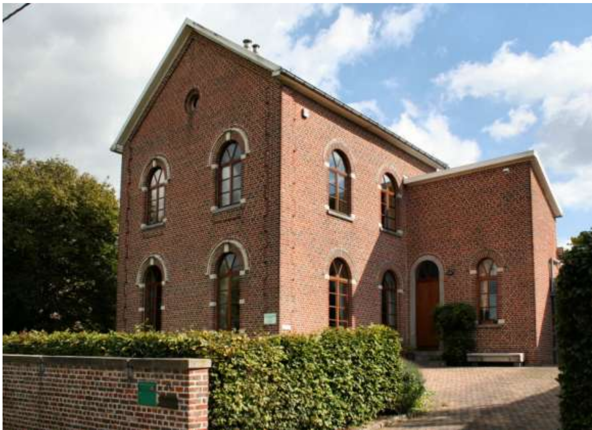
De oude school van Hoxem is nu gerestaureerd