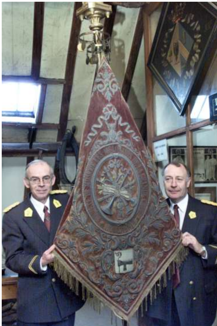
140 jaar VML-harmonie