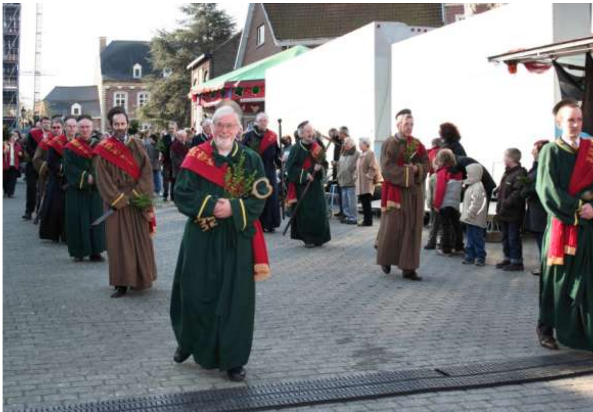
De palmprocessie gaat voor de 375 ste maal uit

– Jeugdhuys de Klup pakt op Palmzondag uit met een kindermarkt en een gratis springkastelenstraat in de Doelstraat, voor de 375 ste verjaardag van de traditie. Uiteraard lopen ook de