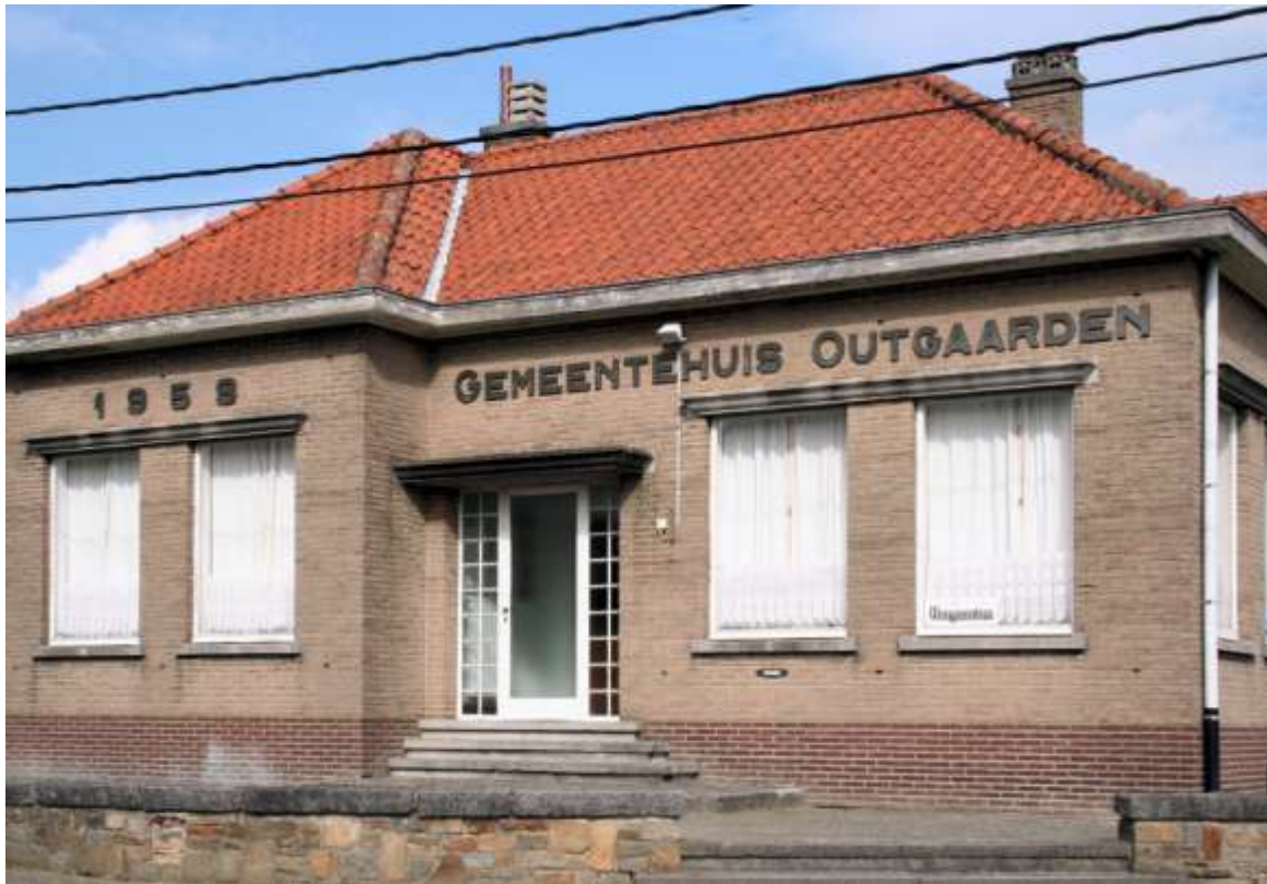
Het voormalige gemeentehuis van Outgaarden doet thans dienst als ontmoetingscentrum

worden nog “De kolonisatie geschiedenis van Hoegaarden en omstreken”, door A. Nijs, en “Het Hoegaards dialect” door