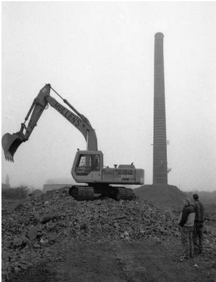
De oude schoorsteen van de Grand-Pont