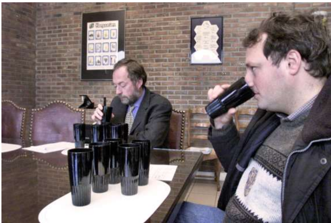
Dagelijks wordt er bier geproefd in de brouwerij

ACTIE TEGEN DE AFSCHAFFING VAN DE MUZIEKSCHOOL – Twintig actievoerders protesteren op het Gemeenteplein tegen de afschaffing van de muziekschool. De twee plaatselijke muziekverenigingen nemen echter niet deel aan de actie. De Vrije Muziek liefhebbers distantiëren zich uitdrukkelijk van het verspreide pamflet, omdat ze zich politiek niet willen laten misbruiken. Tijdens de raadszitting wordt het punt over de afschaffing verdaagd naar de zitting van mei 2001. “We proberen een oplossing te vinden”, zo laat burgemeester Frans Huon weten. Uiteindelijk wordt de muziekschool niet afgeschaft. Voor het jaar 2001-2002 wordt ze alleszins behouden. De muziekschool verhuist alleszins naar de Polder.