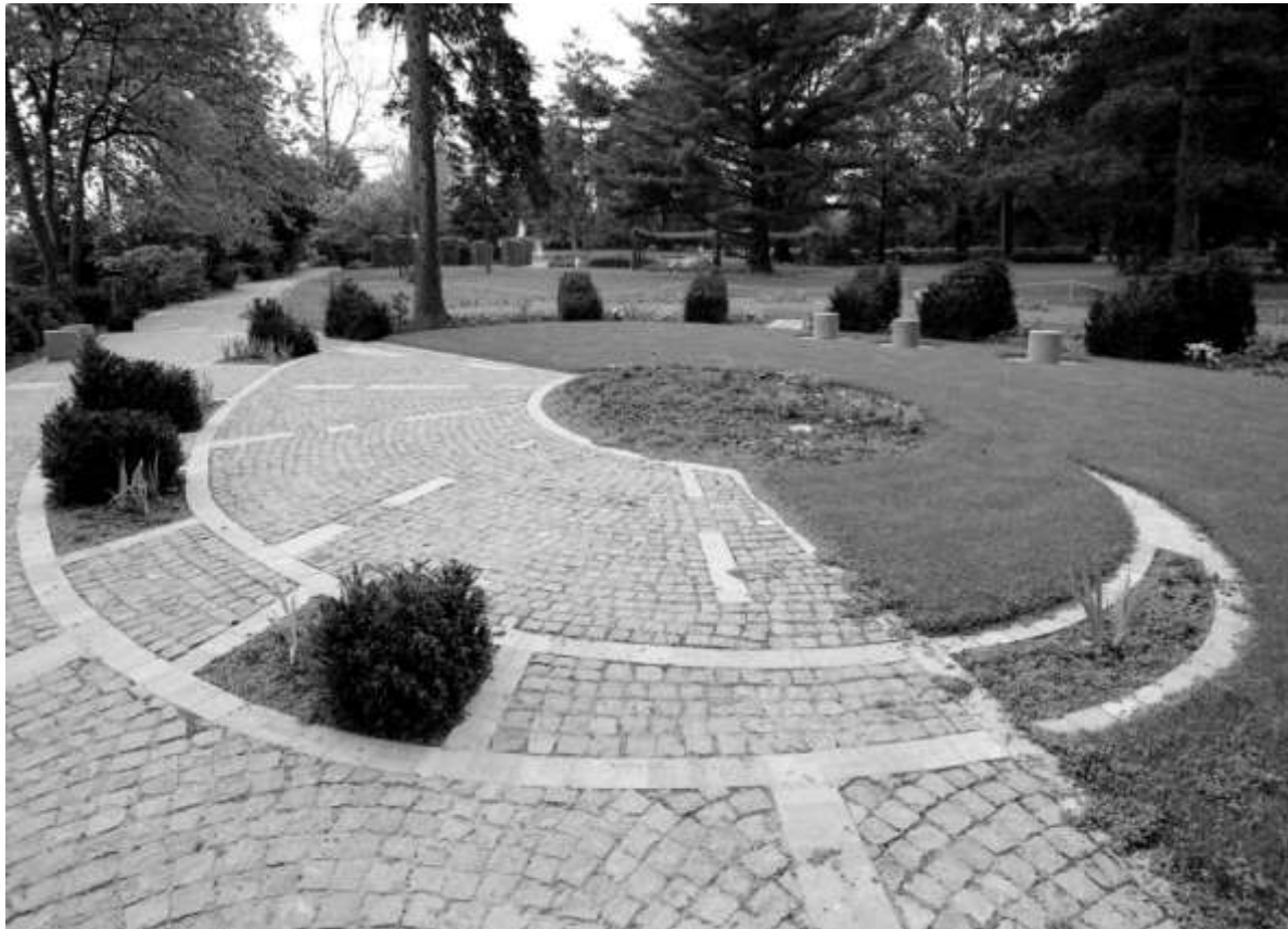
De pas aangelegde Koning Boudewijntuin

rododendrons, Japanse esdoorns en hortentia's. De aanleg van de tuin kost 2,6 miljoen frank. De bedoeling is jaarlijks in de tuin, rond de overlijdensdatum van Koning Boudewijn, einde juli, bloemen neer te leggen.