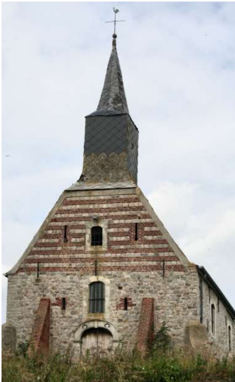
De Vlooienskapel of Sint-Servaaskapel van Rommersom

MEERDERE VOETBAL-KAMPIOENEN IN DE GEMEENTE – Racing Meldert is een week geleden kampioen geworden in vierde provinciale, en nu is het de beurt aan twee Hoegaardse clubs om te vieren. Sporting Hoegaarden wordt kampioen in 2 de provinciale en de Klup in 3 de afdeling van de liefhebbersvoetbalbond. Beide ploegen feesten op dezelfde zondag. Bij Sporting wordt een autokaravaan ingericht en er volgt een geïmproviseerd bal.