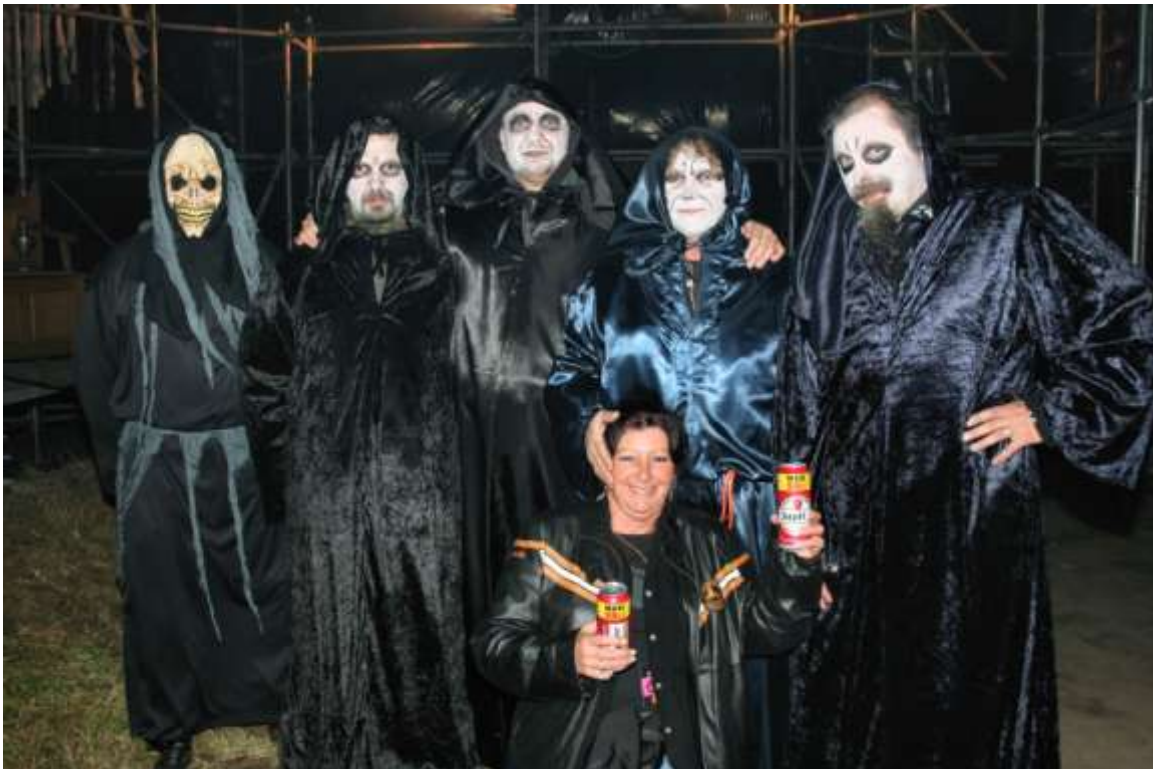
De Halloweentocht van de Klup is een klassieker geworden

GISTINGSTANKS WEG – InBev is met de verhuizing van de gistingstanks van brouwerij de Kluis naar Jupille gestart. Met een kraan van 56 meter hoog worden de tanks omhoog geheven, om 's nachts met uitzonderlijk vervoer te verscheppen naar Jupille. Tien van de gistingstanks verhuizen. Ze hebben een hoogte van 14,50 meter