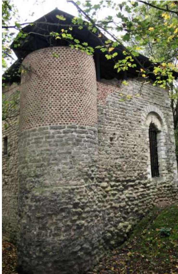
De donjon van Meldert

rijn om nog samen op het gemeentehuis te vergaderen voor de raadszittingen. De fracties mogen nog wel apart vergaderen, maar zonder hun partijvoorzitter.