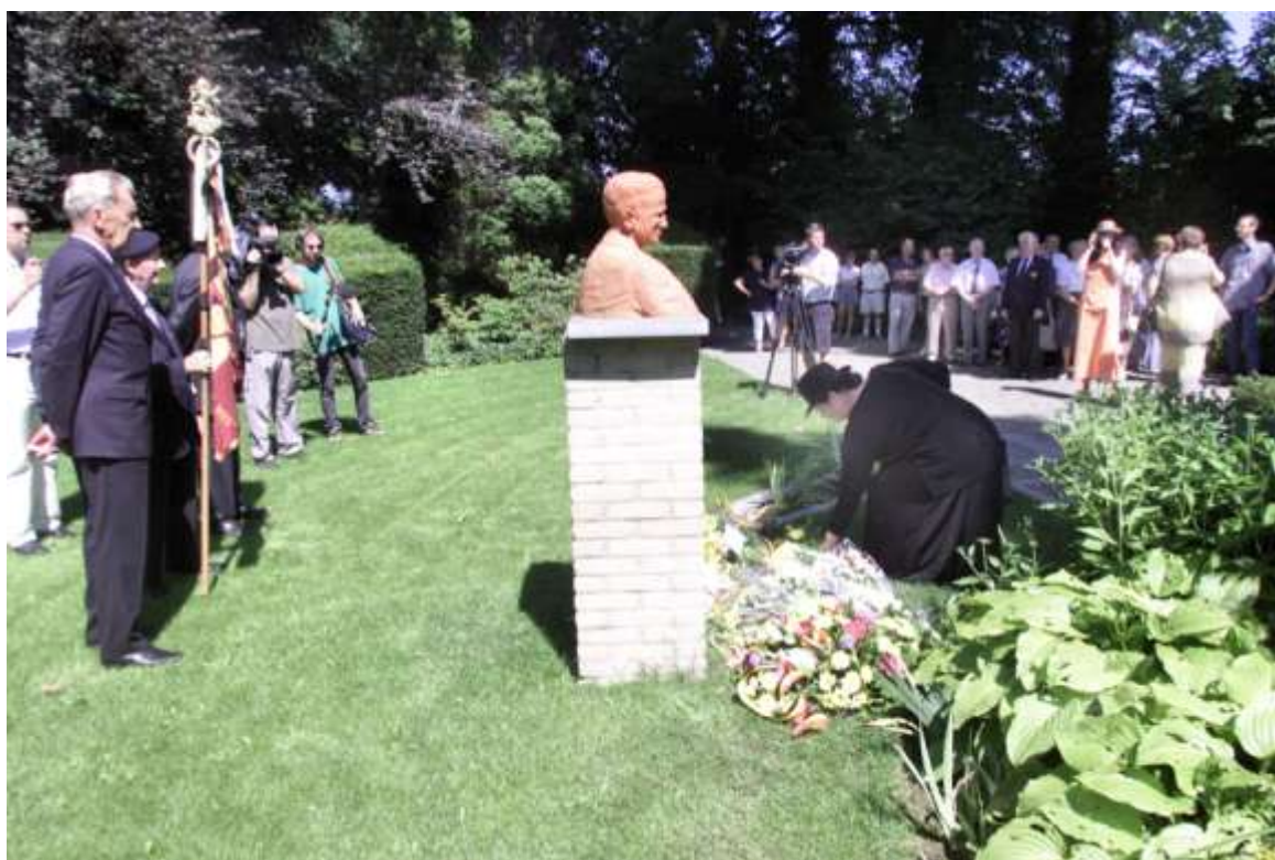
De Bloemenhulde in de Koning Boutewijntuin

juli wordt beslist aan het gemeentepersoneel en aan het OCMW-personeel maaltijdcheques toe te kennen. Het gaat om 12.000 frank per full time personeelslid per jaar. Dit lokt een open protestbrief aan het schepencollege uit, ondertekend door 26 personeelsleden. De ondertekenaars stellen dat in de bedrijfswereld de voordelen veel groter zijn, en dat ook de weddeverhoging van de burgemeester en de schepenen veel hoger ligt. “Wordt er bespaard op de maaltijdcheques om de weddes van de beleidsmensen te