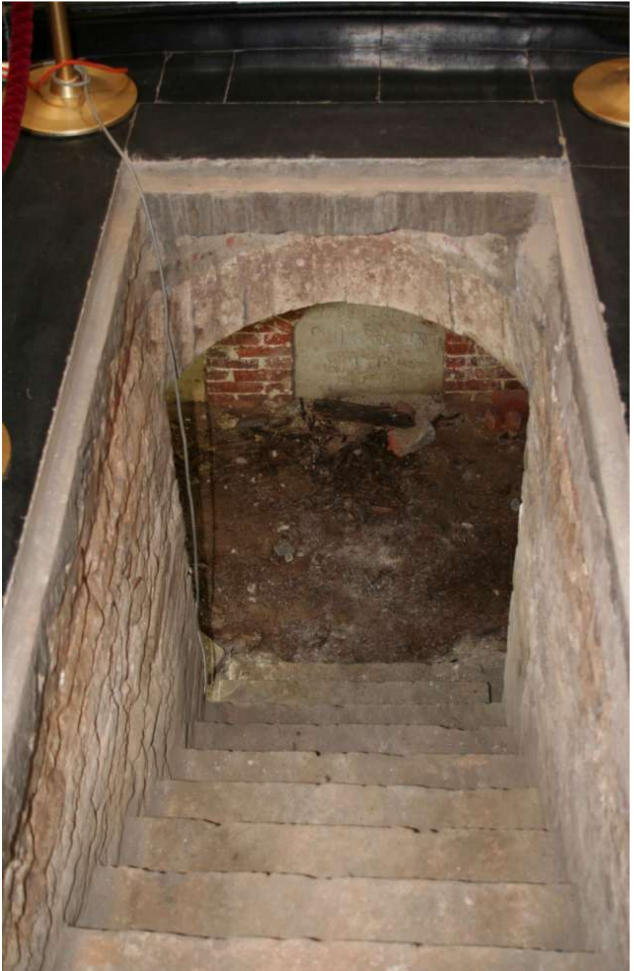
De crypte van de Vijf Geslachten in de Sint-Gorgoniuskerk