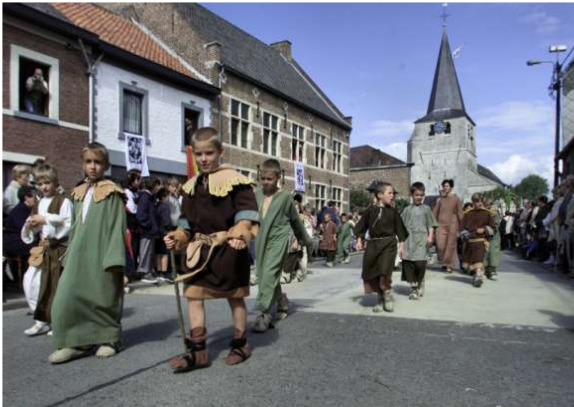
Heel wat deelnemers en toeschouwers voor de Sint-Ermelindisstoet

Bij deze gelegenheid wordt ook Gaston Roelants gehuldigd, als atleet van de eeuw. Gaston Roelants, die in Meldert woont, is een levende sportlegende: hij werd olympisch en Europees kampioen, won viermaal de landencross, de Suikercorrida