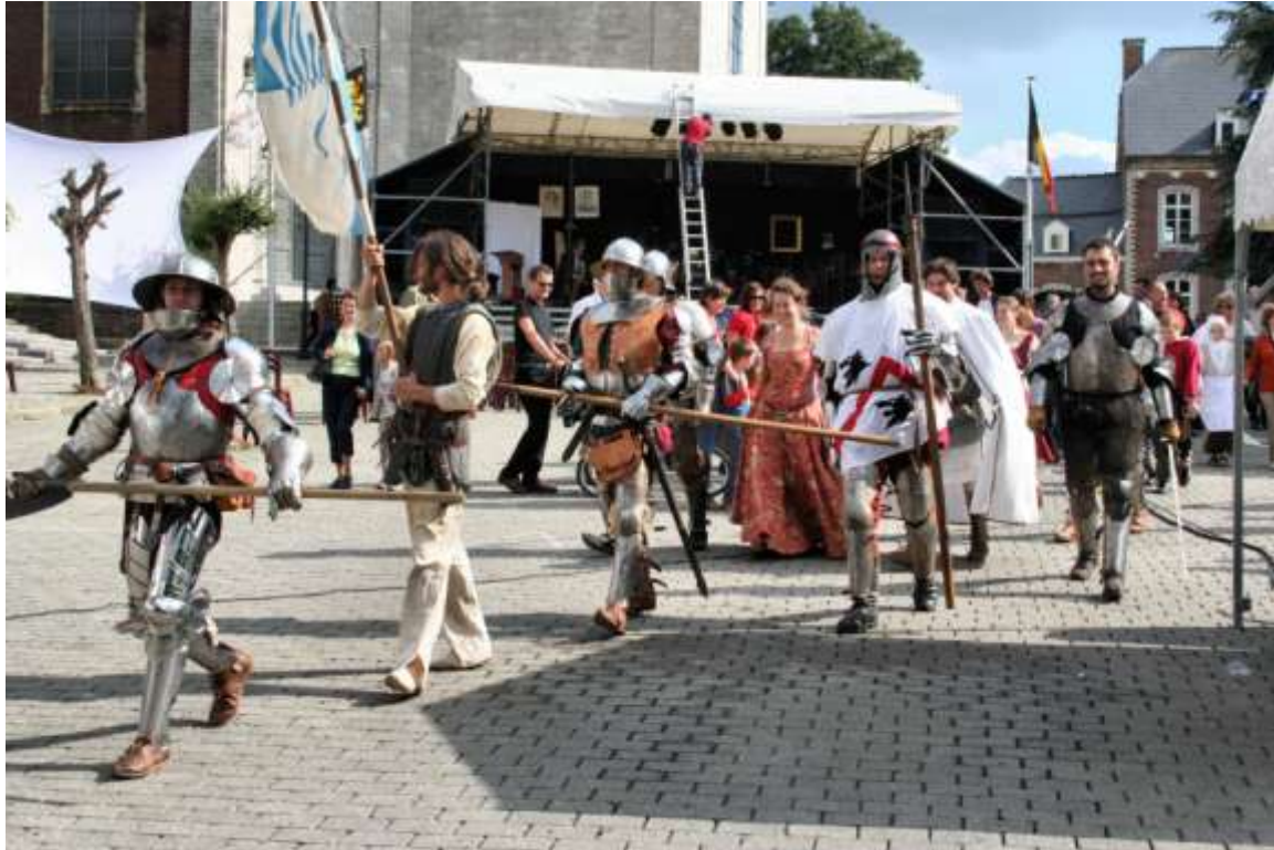
Een middeleeuws spektakel voor 1025 jaar Hoegaarden

DAG VAN DE JEUGD – Voor de jeugdverenigingen zijn het drukke dagen, want de jeugd-raad pakt op 26 augustus uit met een dag van de Jeugd. Chiro Hoegaarden, KLJ-Meldert, de Klup en 't Paenhuys doen mee, en staan daags erna ook klaar om te tappen op “1025 jaar Hoegaarden”.