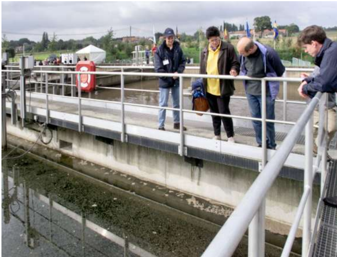
De opening van het waterzuiveringsstation van Aquafin

station van Aquafin in Klein-Overlaar, tijdens een openingsweekend. De installatie werd al in 1996 en 1997 gebouwd, en een eerste poging tot opening in 1999 viel in het water door een modderstroom in het dorp. Pas nu kwam de officiële opening. De bouw ervan heeft 75 miljoen frank gekost. Het station kan het afvalwater van 5000 inwoners zuiveren. Wanneer ook het afvalwater van Outgaarden naar het station komt, wordt de maximale capaciteit bereikt.