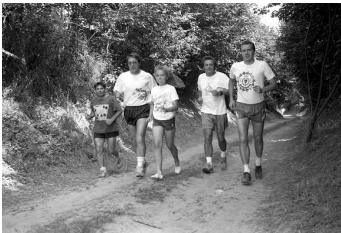
Bij de voorstelling van de eerste holle wegen jogging

1 ste HOLLE WEGEN JOGGING – Op zaterdag 21 september wordt de 1 ste editie van de holle wegen jogging gelopen.