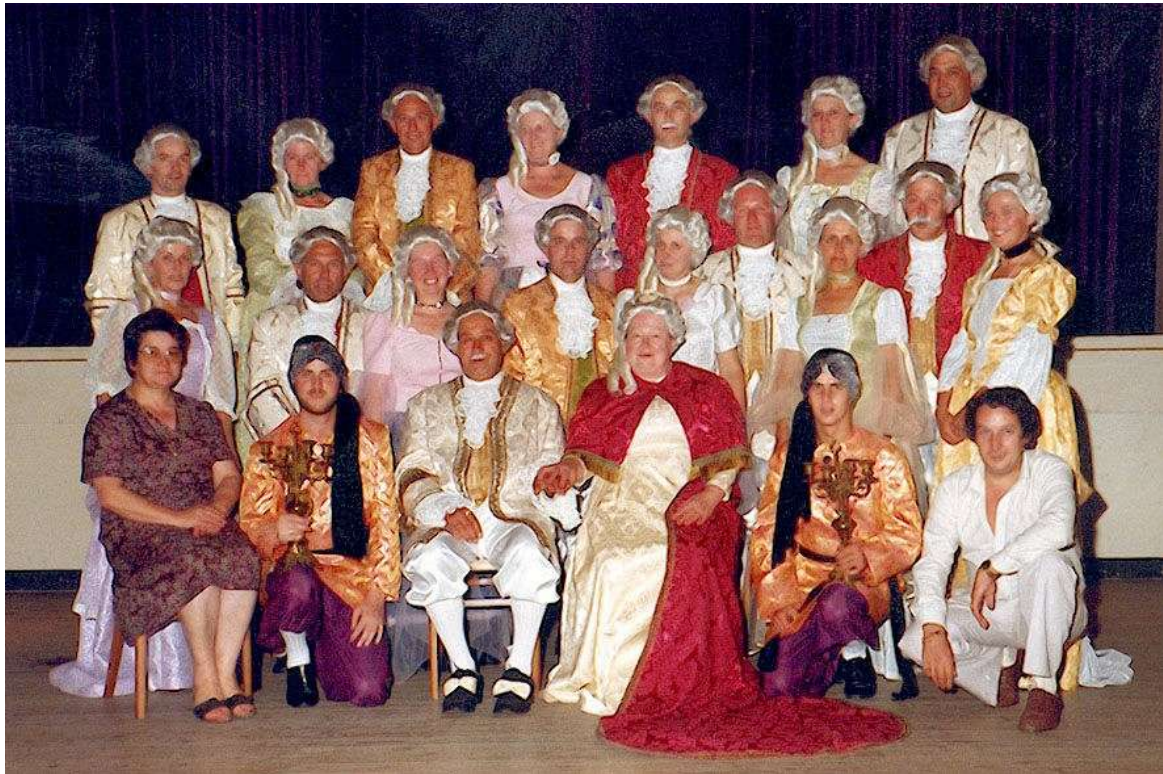
De volksdancers van de Klup voeren "de Zonnekoning" op bij de verzusteringsactiviteiten met Rumigny

Een eerste keer is er slijk op het Gemeenteplein, de tweede maal loopt het kruispunt aan de Beek onder het slijk. Ook de Nermstraat wordt een slijkpoel. Hoegaarden blijft grotendeels gespaard van de wateroverlast, maar Outgaarden wordt hevig getroffen door regenval. De hoofdstraat aan de kerk wordt bedekt met een dikke slijklaag.