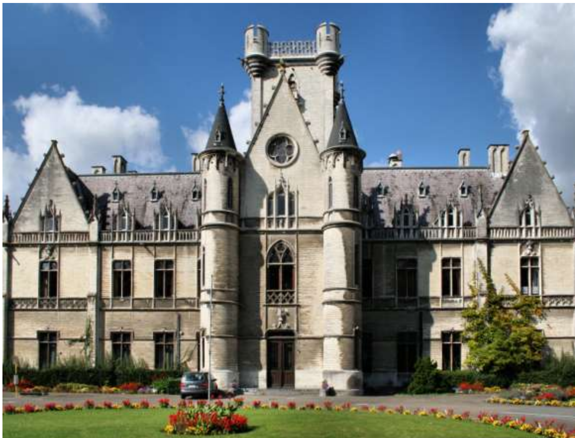
Het kasteel van Meldert, nu Sint-Janscollege

tussen de twee Luikse enclaves, Bevekom en Hoegaarden. Er werd tol geheven te Gaet, een gehucht dat nu op Meldert en Sluizen ligt. In de 15 de eeuw ontstond een conflict tussen de heren van Meldert en Sluizen, over de grenzen van de parochie Sluizen. Onder Maximiliaan van Habsburg, aan het einde van de 15de eeuw, waren de verwoestingen in Meldert zo groot, dat het dorp van 1488 tot 1490