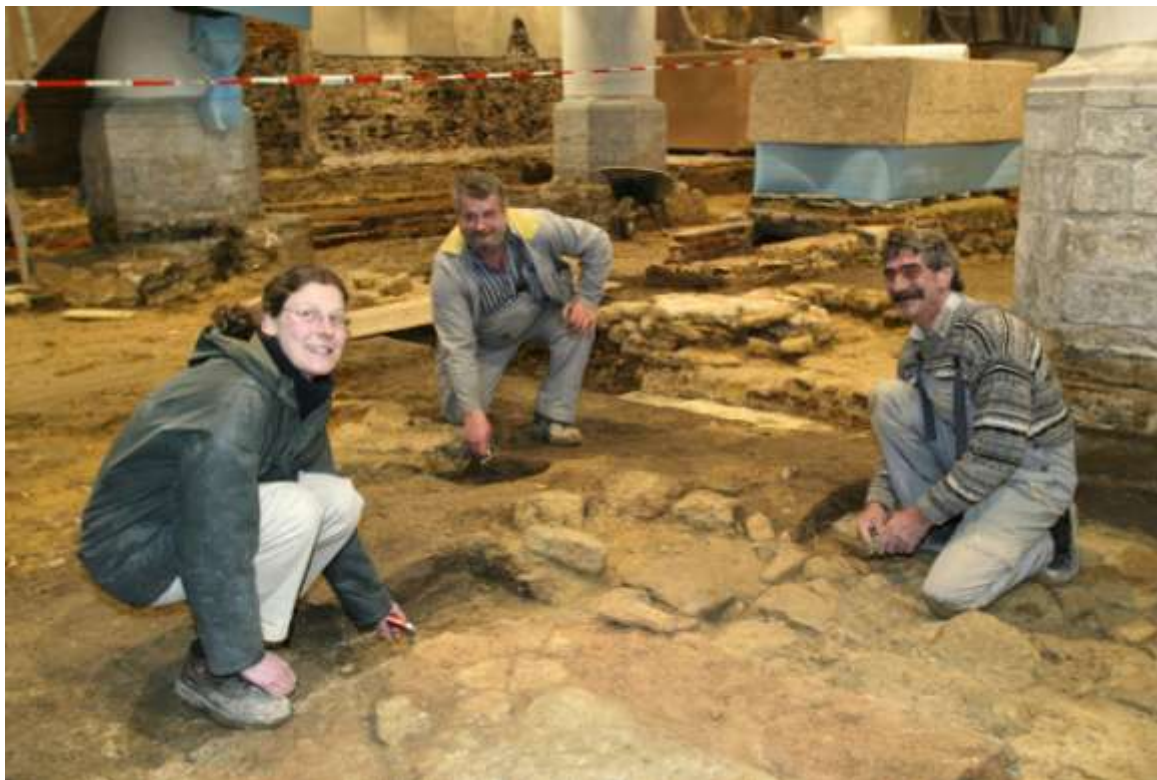
In de Sint-Ermelindiskerk zijn archeologische opgravingen aan de gang

schermd worden. En dit terwijl de gemeenteraad van januari nog een bedrag van 940.000 euro goedkeurde om de kerk-