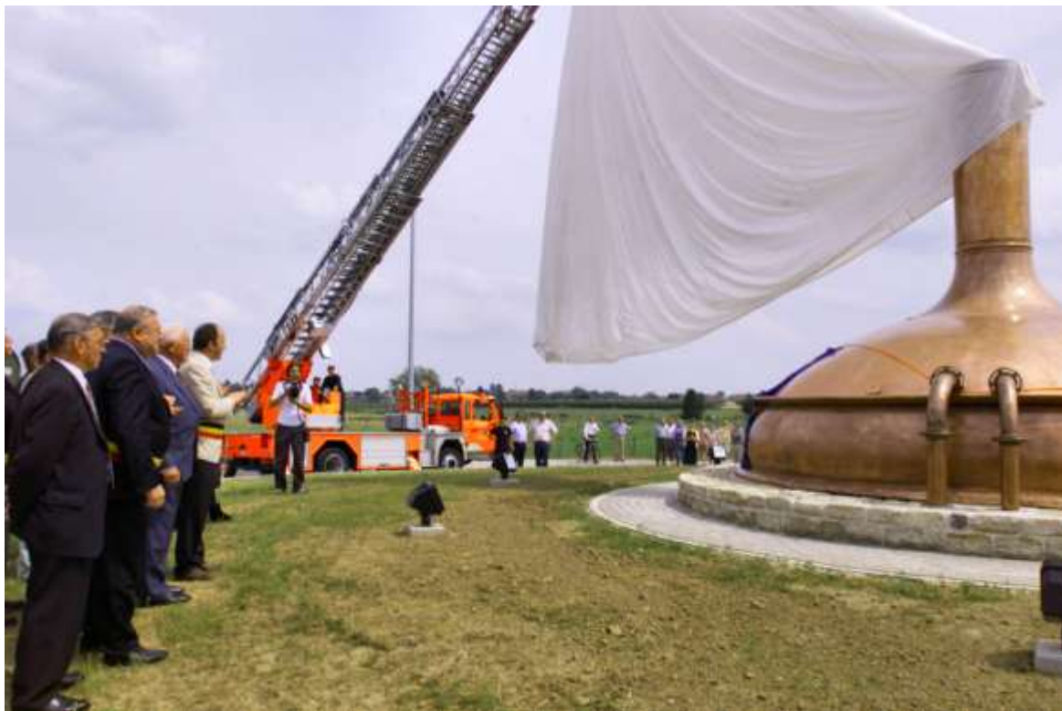
De rotonde met bierketel wordt ingehuldigd

– Het Paenhuys Park is weer in orde dus kan het jaarlijkse festival er weer plaats vinden. Vorig jaar bleven heel wat mensen weg uit de sporthal, omdat het er niet gezellig is. “Zelfs bij regenweer komt er meer volk voor het festival, naar het Paenhuyspark, dan in de