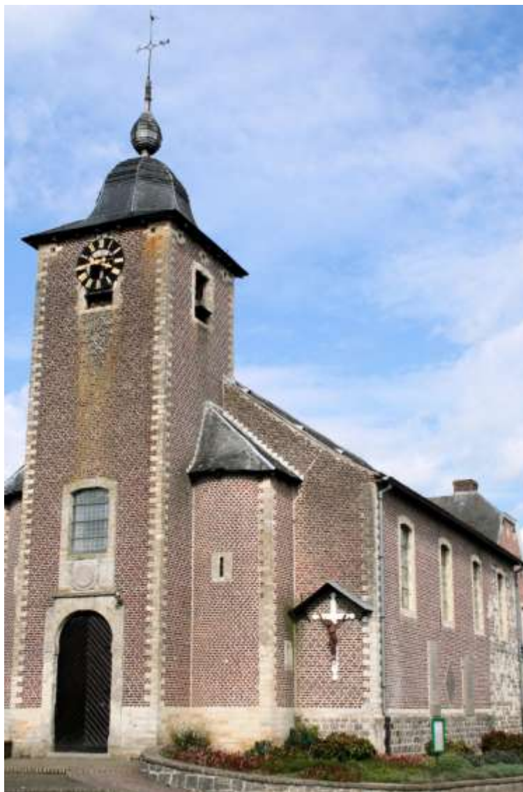
De Sint-Niklaaskerk van Outgaarden