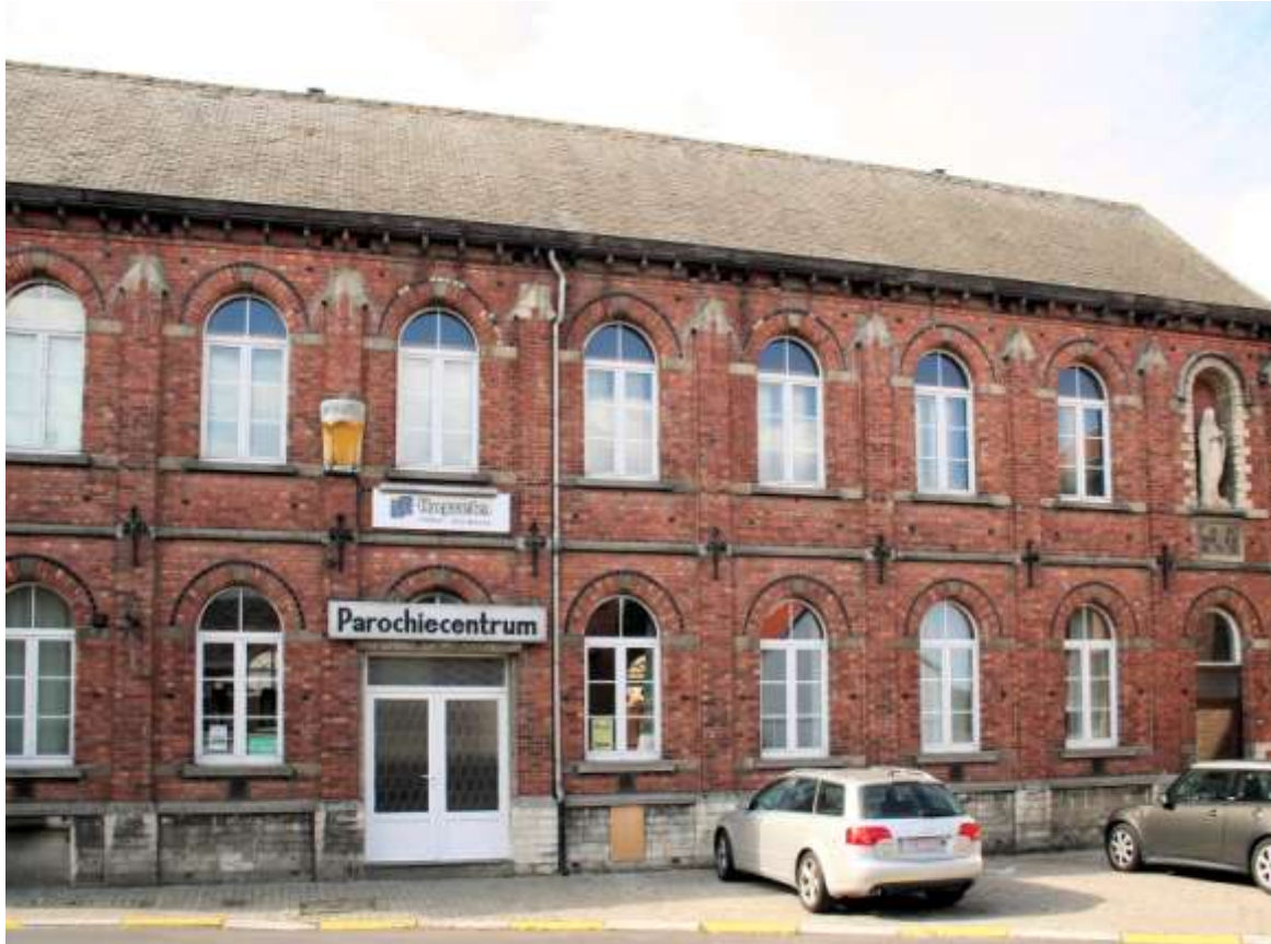
Het Patronaat wordt parochiecentrum

GEBOUW CHIRO - De jongenschiro, opnieuw gestart in 1967, had inmiddels de leegstaande woning van het parochiecentrum ingepalmd. Ze verlieten het huis nadat ze een eigen lokaal hadden gebouwd. In de loop der tijden raakte dit