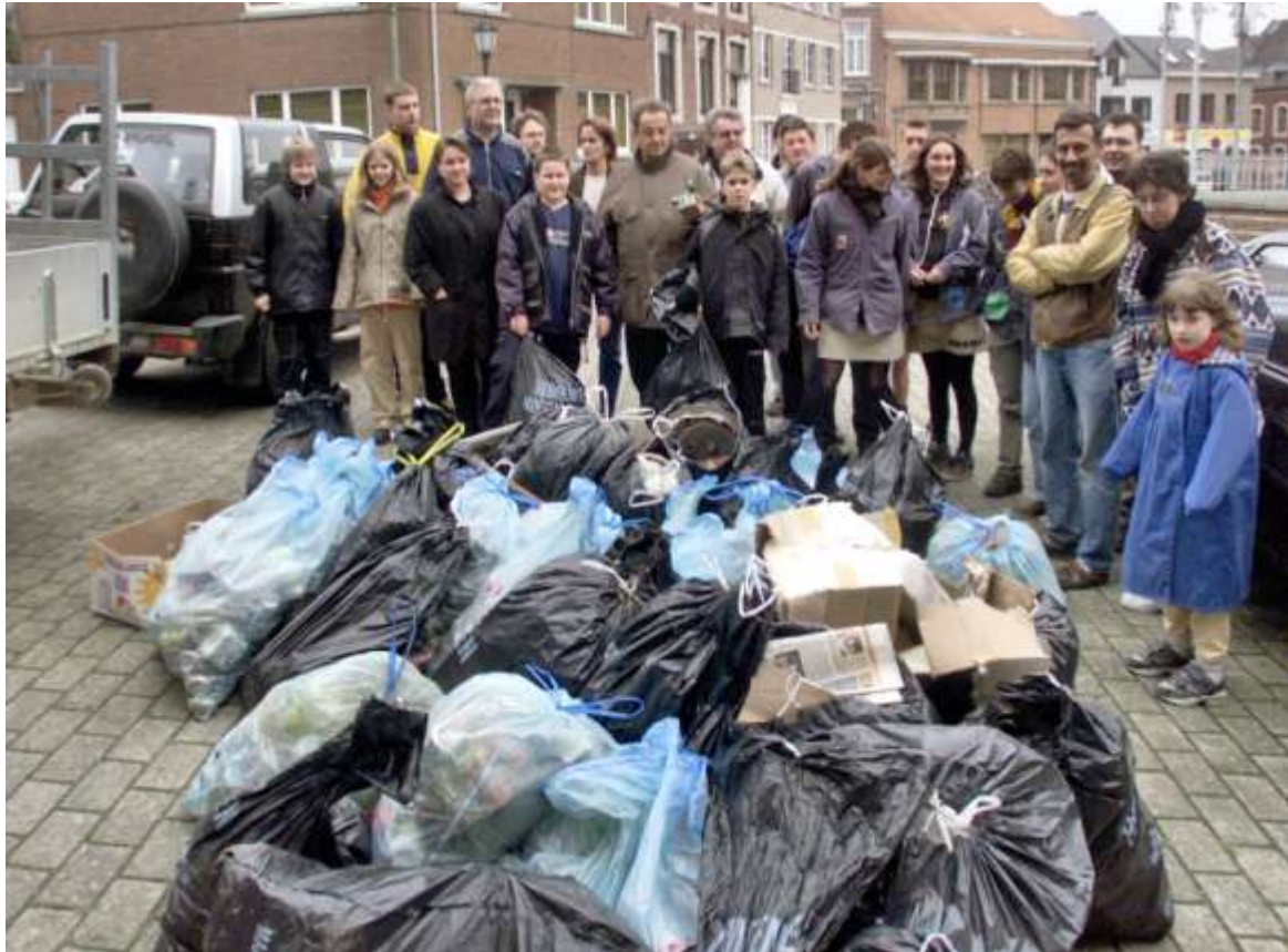
Grote opruimactie van zwerfvuil

FOTOMODEL VOOR EEN DAG – De zolder van de Klup wordt twee weekends lang omgetoverd tot fotostudio. De jongeren van de Klup worden eventjes fotomodel. De fotoclub van de Klup staat achter dit initiatief. "We willen de jongeren vertrouwd maken met fotografie. We willen hen ook