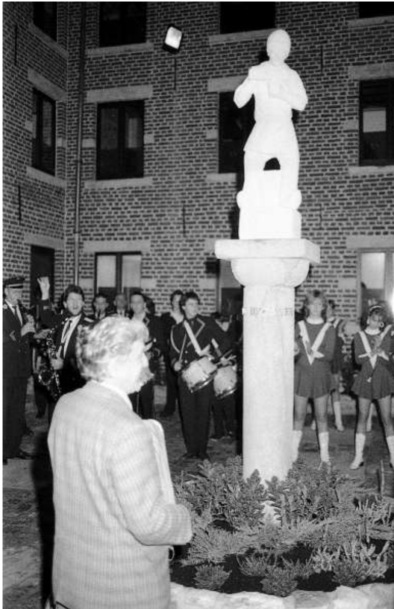
De inhuldiging van het biermanneke

VERKAVELING TOMME- STRAAT – De wegeaanleg van de verkaveling Tommestraat wordt goedgekeurd op de gemeenteraad. Er worden 30 sociale woningen gebouwd en op 10 kavels mogen de eigenaars vrij een huis bouwen. De prijs van de woningen schommelt rond 3,1 miljoen frank.