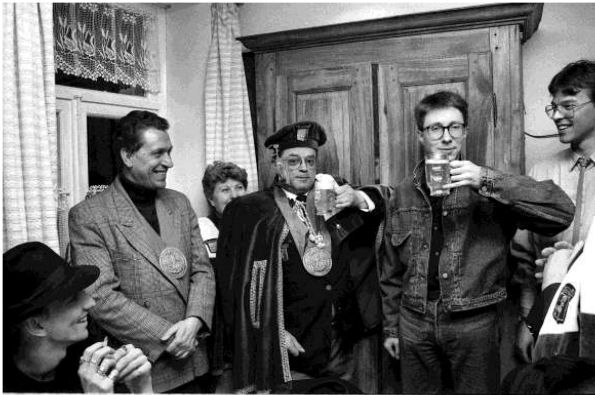
Clouseau wordt tot Hoegaardier geslagen

CLOUSEAU TOT HOEGAARDIER – Clouseau treedt op in de sporthal en de Edele Orde vanden Moutstock laat de groep symbolisch tot Hoegaardier slaan, in de Carrousel. Koen Wauters laat zich niet betrappen met een pint in de hand, dus worden de honneurs waargenomen door bassist Karel Theys, terwijl Kris Wauters