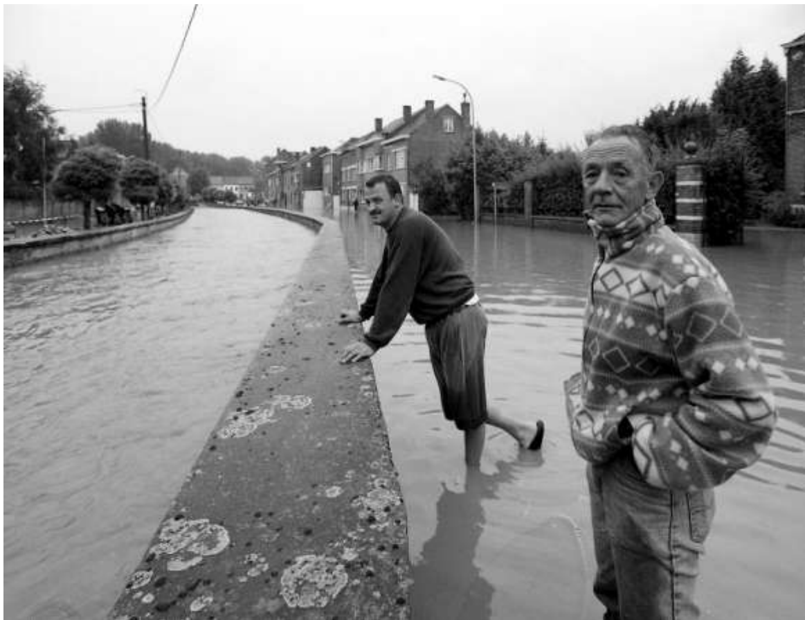
Het water stond bijzonder hoog aan de Vroente en de Slachthuisstraat

1500 FIETSERS – De Hoegaardse fietsroute gaat naar een ongekend succes, want er wordt dit seizoen gerekend op 15.000 fietsers. Er werden 3500 kits bijbesteld. Einde september rekt men zelfs op 18.000 deelnemers.