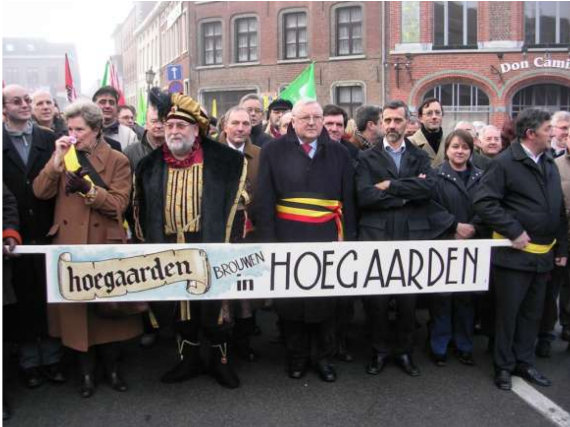
Het gemeentebestuur opent de Stille Optocht