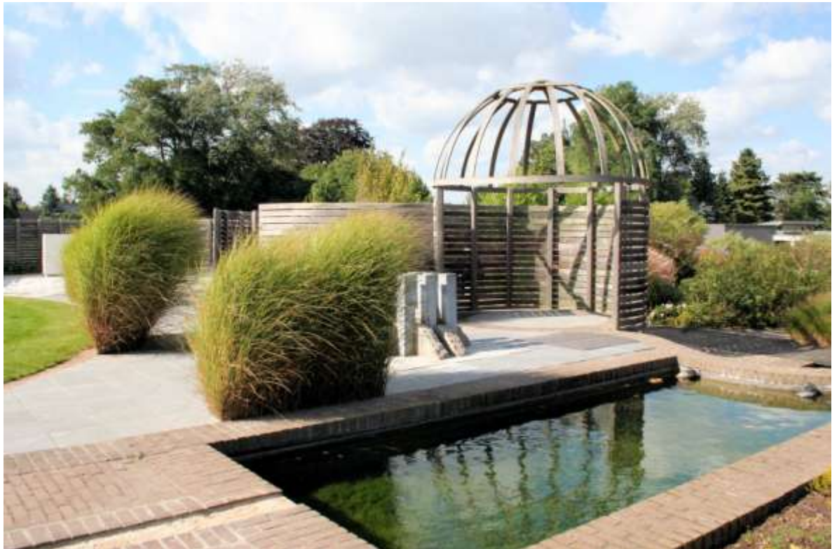
De VLAM-tuin achter de Vlaamse Toontuinen