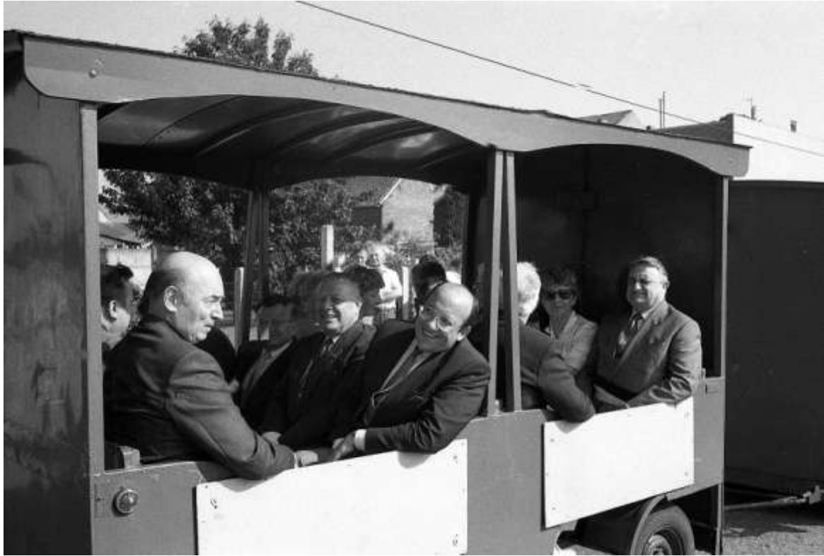
De opening van het Ravelfietspad met treintje

WERKEN TOMSIN AAN KANT VROENTE – De werken aan het goed Tomsin worden uitgevoerd door de gemeente, zonder op subsidiëring te wachten. Er komt een toegangsweg langs de Vroentestraat met 15 parkeerplaatsen en riolering. In een 2 de fase worden de toegangsweg tot de Tiensestraat en de tennisvelden aangelegd. De kostprijs voor dit eerste deel wordt geraamd op 828.778 frank.