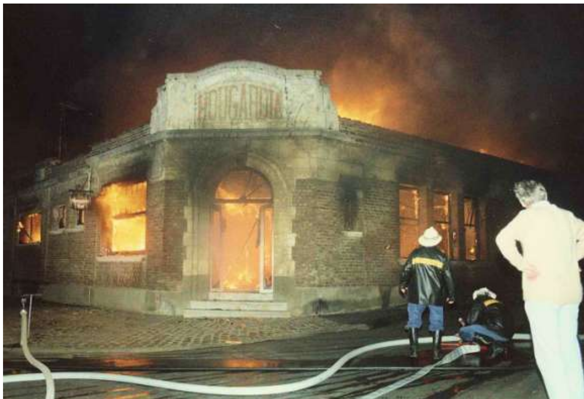
De oude Hougardia, of brouwerij de Kluis staat in brand

landbouwbedrijfbedrijf stopzetten. Voorlopig mag de pachter in de hoeve blijven wonen.