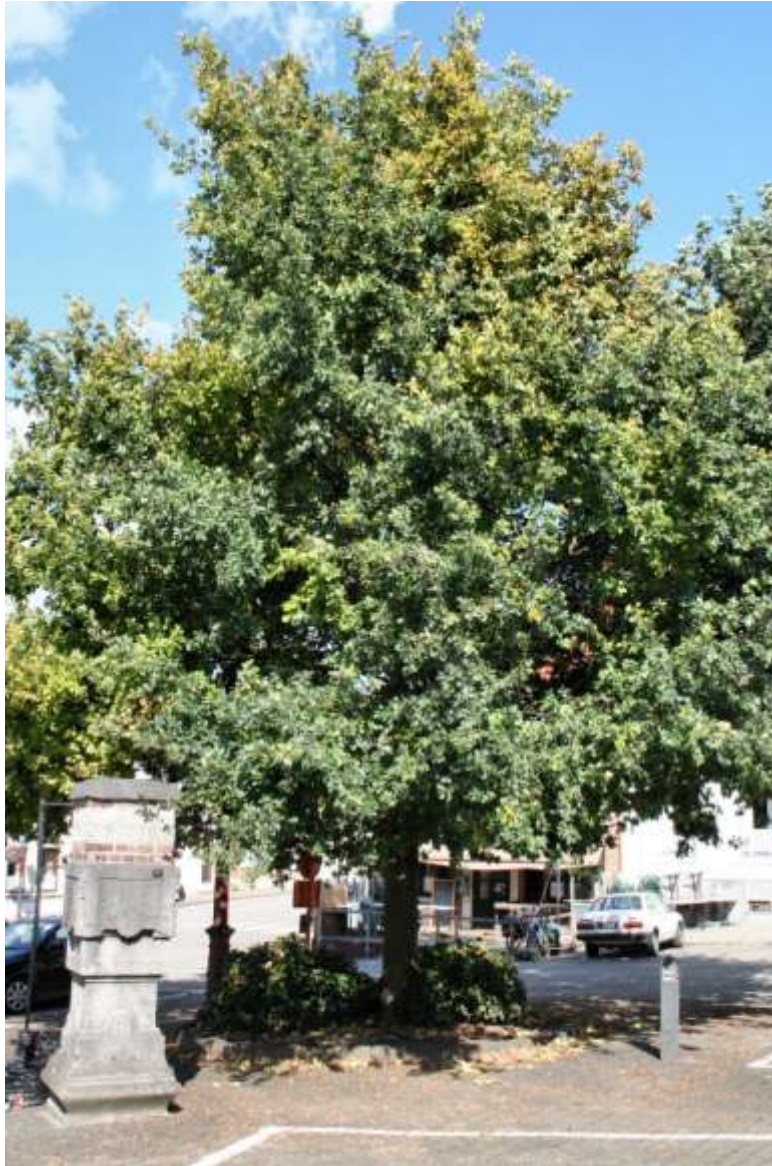
De huidige vrijheidsboom met de oude waterpomp

beschermd door een muurtje met hekken. Van af dan was de liberale gedachte in Hoegaarden blijkbaar sterk genoeg om de boom tot op heden te bewaren. Nu stierf hij aan vervuiling en ziekte.