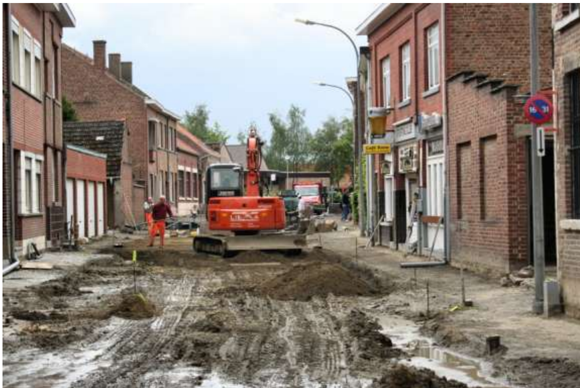
In het voorjaar 2006 werd de Stoopkensstraat opnieuw aangelegd

WERKNEMERS WILLEN NIET IN WEEKEND WERKEN – De vakbondsafgevaardigden van de brouwerij Hoegaarden zijn woest op InBev. De directie wil de werknemers ook in de weekends en op feestdagen laten werken, omdat de