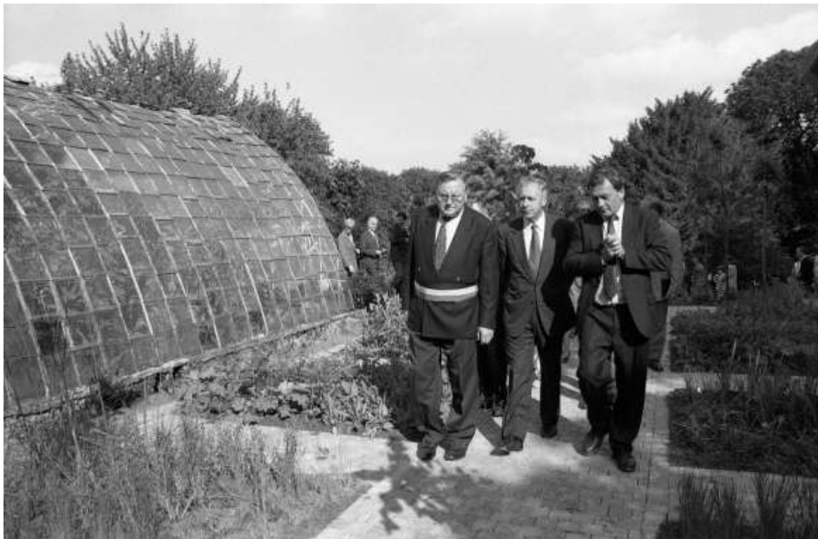
Minister Gaston Geens met burgemeester Frans Huon en Johan Roggen bij de inhuldiging van de Vlaamse Toontuinen

PAENHUYS PARK HAPPENING MET NOORDKAAP – Op 12, 13 en 14 juli is er de Paenhuys Park Happening, met