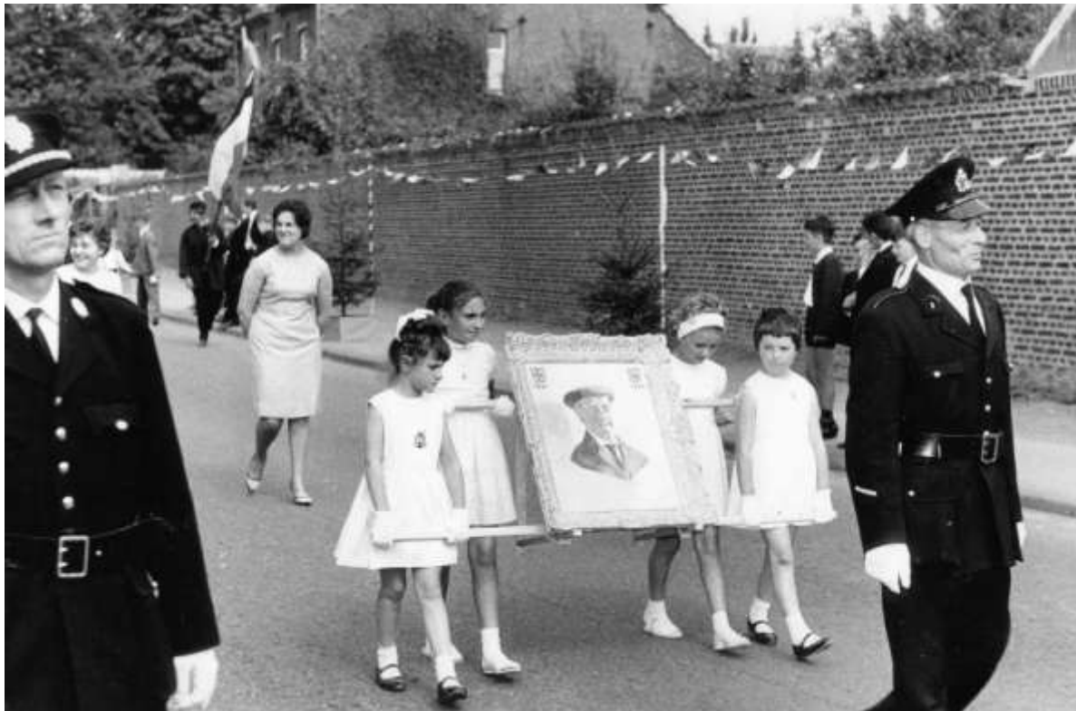
De opening van de stoet van Bare Bessem

AANBESTEDING WEG MELDERT – De gemeenteraad keurt het aanbestedingsdossier goed voor de vernieuwing van de weg Meldert-Hoegaarden, en van de Oorbeeksesteenweg. De