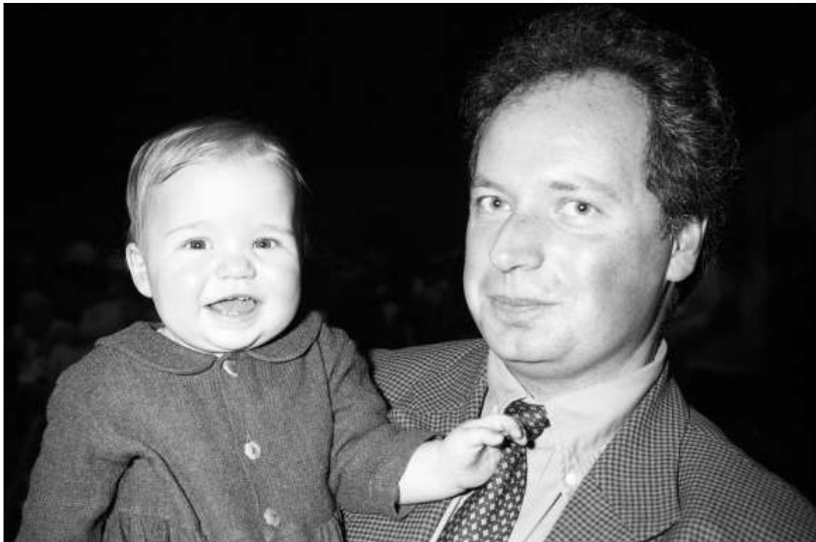
De 6000 ste inwoner wordt begroet in de sporthal

– Normaliter is het nieuwe rusthuis gepland voor over twee jaar, en zal de overgang van 2000 naar 2001 in het nieuwe rusthuis kunnen gevierd worden. Op 17 januari komt het BPA voor de commissie Ruimtelijke Ordening en einde maart kan het BPA in orde zijn. De