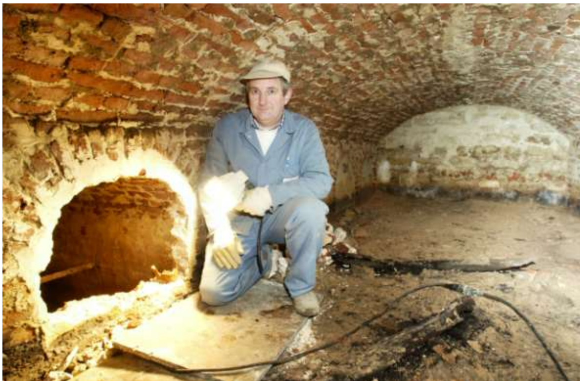
In de Sint-Rochuskapel wordt een crypte blootgelegd

Bij het begin van de restauratiewerken van de Sint-Rochuskapel wordt meteen een geheime crypte gevonden. De kapel die dateert van 1763, werd de laatste tijd nog alleen gebruikt bij feesten van de Congregatie of bij begrafenis van zusters. Het dak lekte, de muren en de vloer verzakten. Er werd een restauratiedossier opgesteld, en in 1995 werd een vzw opgericht, “de Vrienden van de Sint-Rochuskapel”. Zuster Eliane Nieuwborg, overste van het klooster is secretaris van de vzw. Het volledige restauratieproject kost meer dan 1,250 miljoen euro, maar wordt voor 80% betaald door de Vlaamse Overheid. In oktober 2003 werden de restauratiewerken aangevat, maar nu kwam een geheime crypte aan de oppervlakte. Het gaat om de