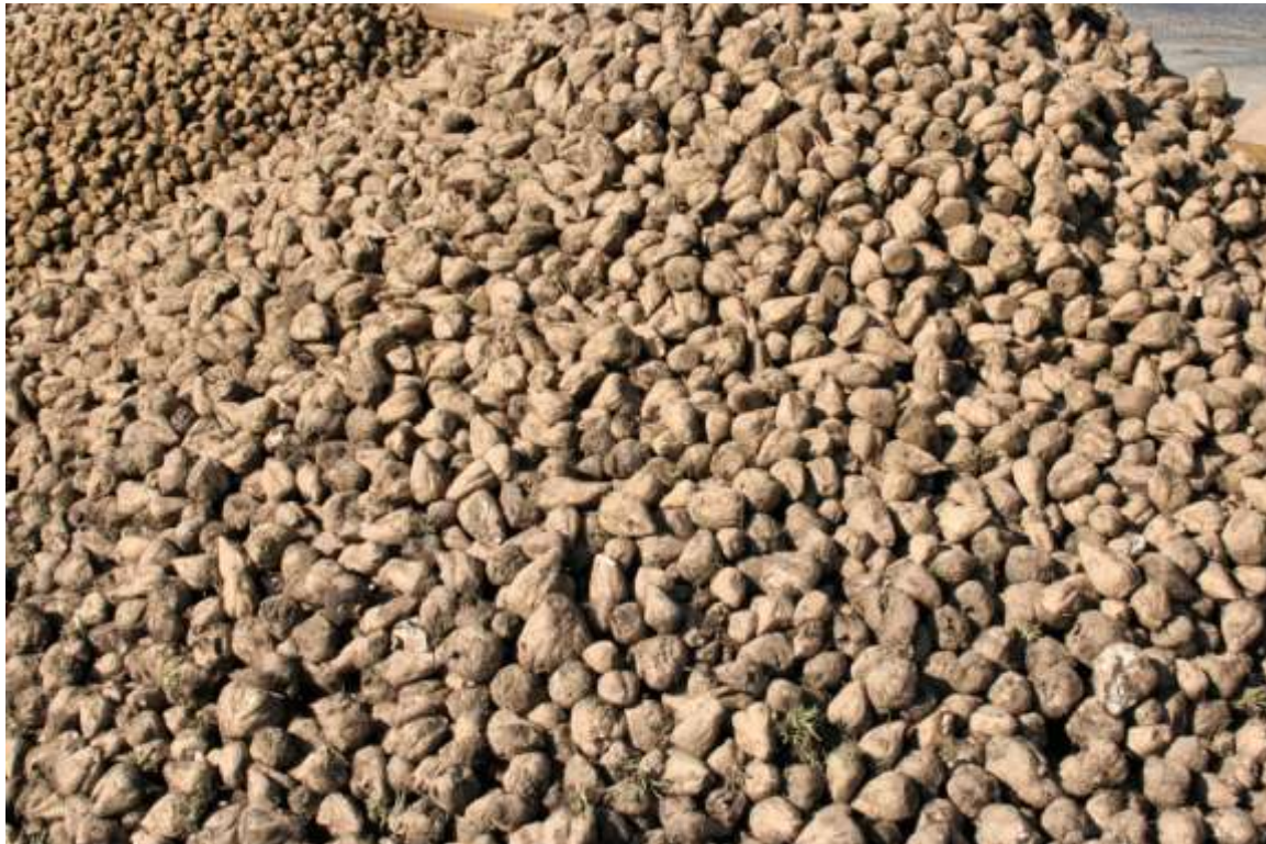
Suikerbieten voor de laatste campagne

NATUUR & LANDSCHAP TEGEN RUILVERKAVELING – Natuur en Landschap, thans Natuurpunt, is gekant tegen de geplande ruilverkaveling in Hoegaarden. Volgens de na-