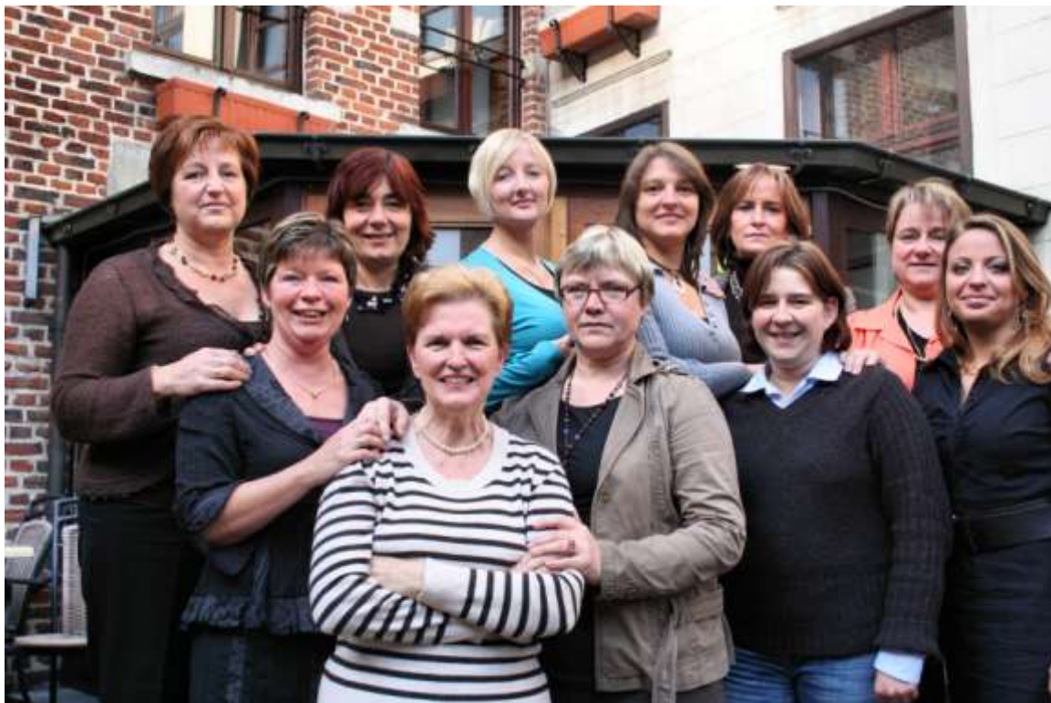
De vrouwelijke raadsleden voeren een affichecampagne tegen borstkanker

om een dorpschool te bouwen. In Hoegaarden heeft het tot 1886 geduurd voor ze in gebruik werd genomen. De faam van de gemeenteschool werd gevestigd in de 2de helft van de 20ste eeuw, met de generatie onderwijzers Dumont-Taverniers-Vandermolen en Guilluy, later uiteraard goed opgevolgd. In 1974 waren er 42 studenten uit Hoegaarden aan het studeren aan de universiteit in Leuven. Op dit ogenblik hebben we een absoluut hoogtepunt qua leerlingen, met opmerkelijk 170 kinderen van over de taalgrens. En voor de komende 10 jaren mogen we nog meer kleuters verwachten. Gewoonlijk worden er in Hoegaarden een 40-tal bouwvergunningen per jaar