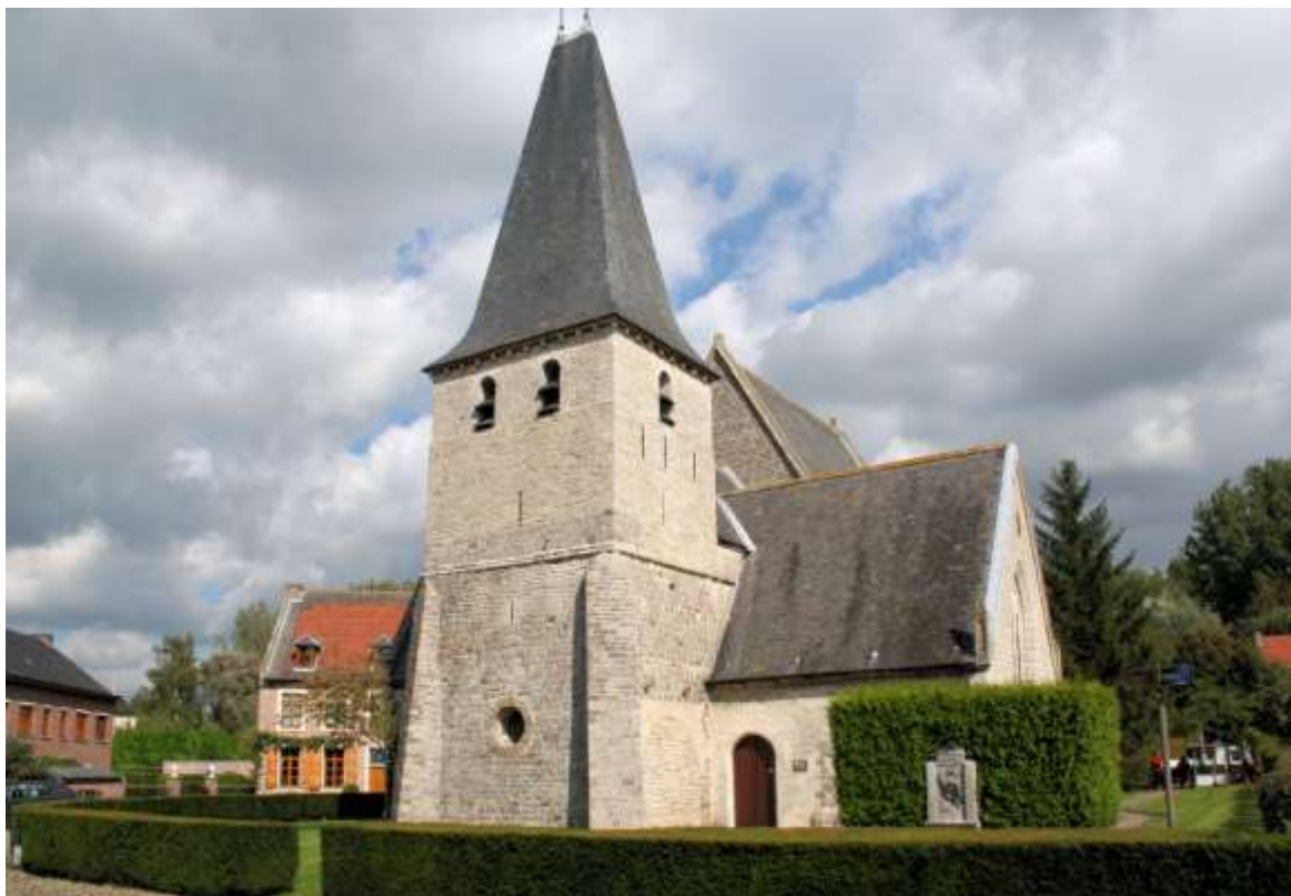
De Sint-Janskerk van Hoxem