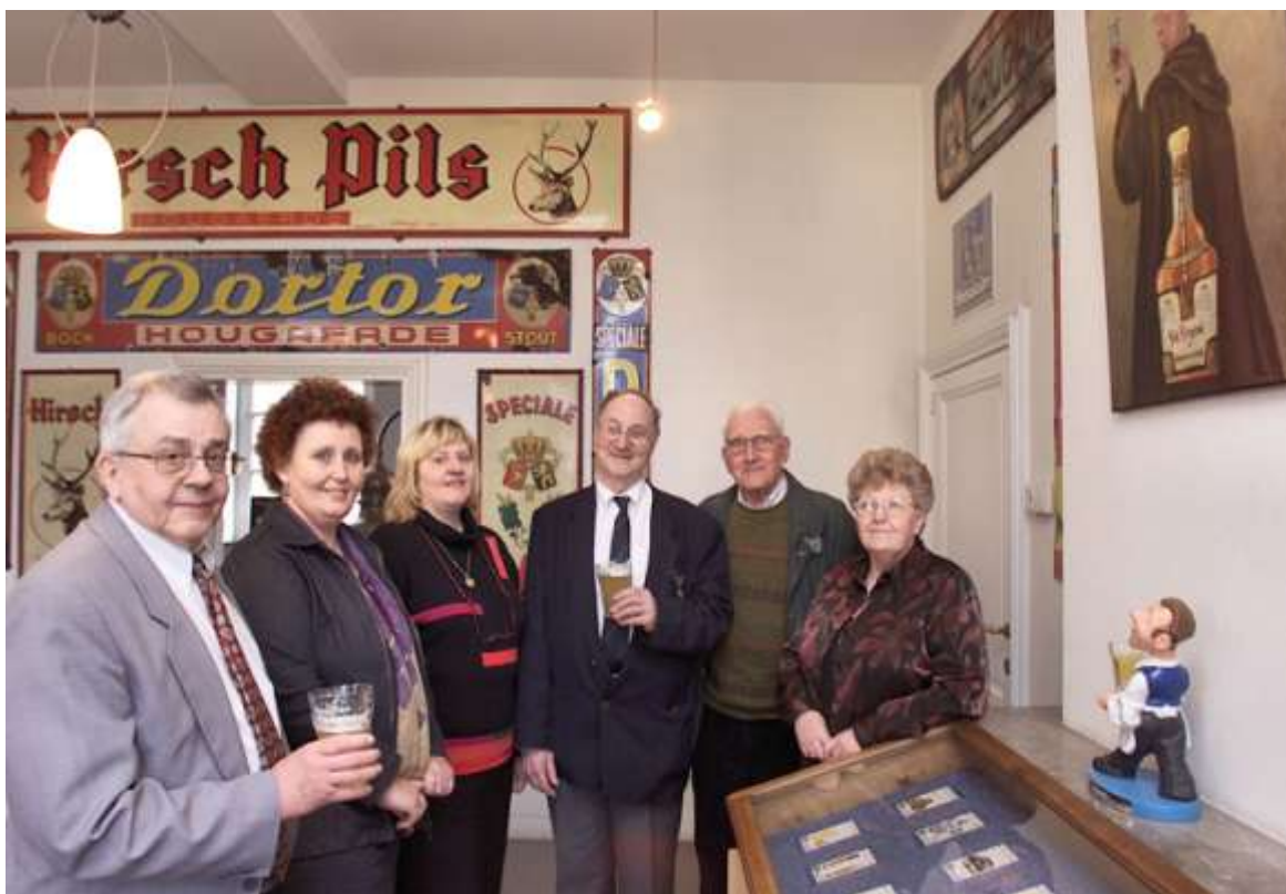
De inhuldiging van het mini-biermuseum in het Kapittelhuis

HOEGAARDEN Kiest DIFTAR – De gemeente Hoegaarden zal een diftar – huisvuilophalingsysteem invoeren. Dit houdt in dat de inwoners hun huisvuil gescheiden moeten aanbieden, en dat ze betalen per hoeveelheid. Het containerpark zal ook niet meer volledig gratis zijn in de toekomst. Diftar werkt met afvalbakken die voorzien zijn van een chip, waarbij de hoeveelheid restafval gewogen wordt. Bij het nieuwe systeem moeten de inwoners op voorhand betalen, via een soort rekening, waarvan het bedrag bij