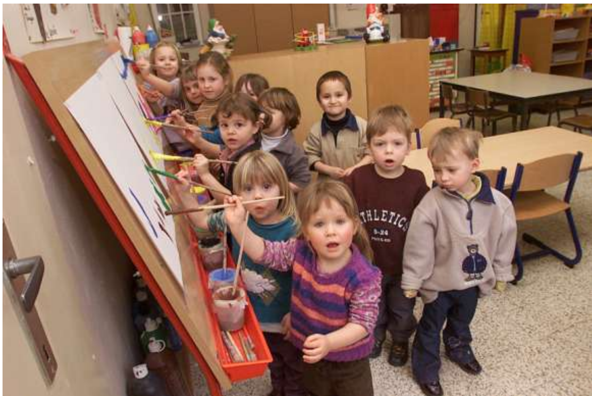
De Boskabouters van het schooltje aan de Meerstraat zijn gered