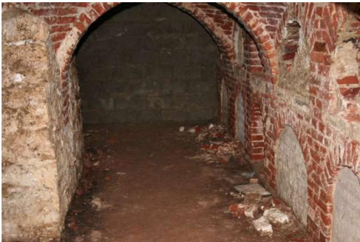
De crypte van de Sint-Gorgoniuskerk werd geopend voor de V Geslachten

CRYPTE SINT-GORGONIUSKERK OPEN - Voor de Regentiedag van de Vijf Geslachten in Hoegaarden werd de crypte van de Sint-Gorgoniuskerk weer geopend op zaterdag 13 oktober. De afstammelingen