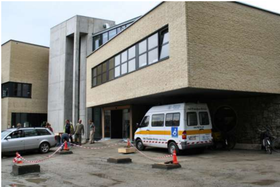
De verhuis van het Sint-Jozefrusthuis naar Villa Hugardis