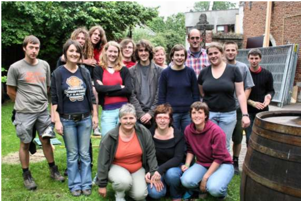
De organisatoren van de 35 ste Paenhuys Park Happening

Op vrijdag 6, zaterdag 7 en zondag 8 juli wordt de 35 ste editie van de Paenhuys Park Happening georganiseerd, met op vrijdag de rockoptredens. Vanaf 18 uur treden op het hoofdpodium Hestia, Pickle Juice, Tripoli, Firehousekeepers, The Rhythm Junk en Foxylane op. In de Box, het randpodium, komen nog Vibe Rock, The Willow Tree Court, Mcclovers, The Q, Zero Gravity en Gino's eyeball. Op zaterdag komt Kevin Major en op zondag is het volksfeest, met 's avonds een retrofiif.