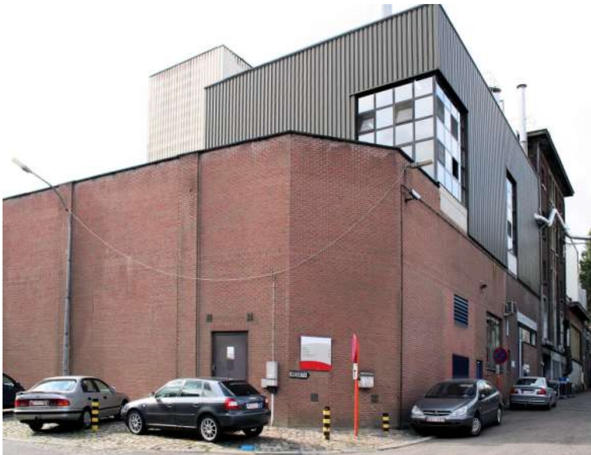
De nieuwe gevel van brouwerij de Kluis

LAATSTE AUTOZOEKTOCHT VOOR ONTSPANNINGSKRING – De Ontspanningskring organiseert een tweedaagse op 30 augustus met een kaartavond Boomke Wies in de Cerkel, en op 31 augustus de laatste toeristische autozoektocht.