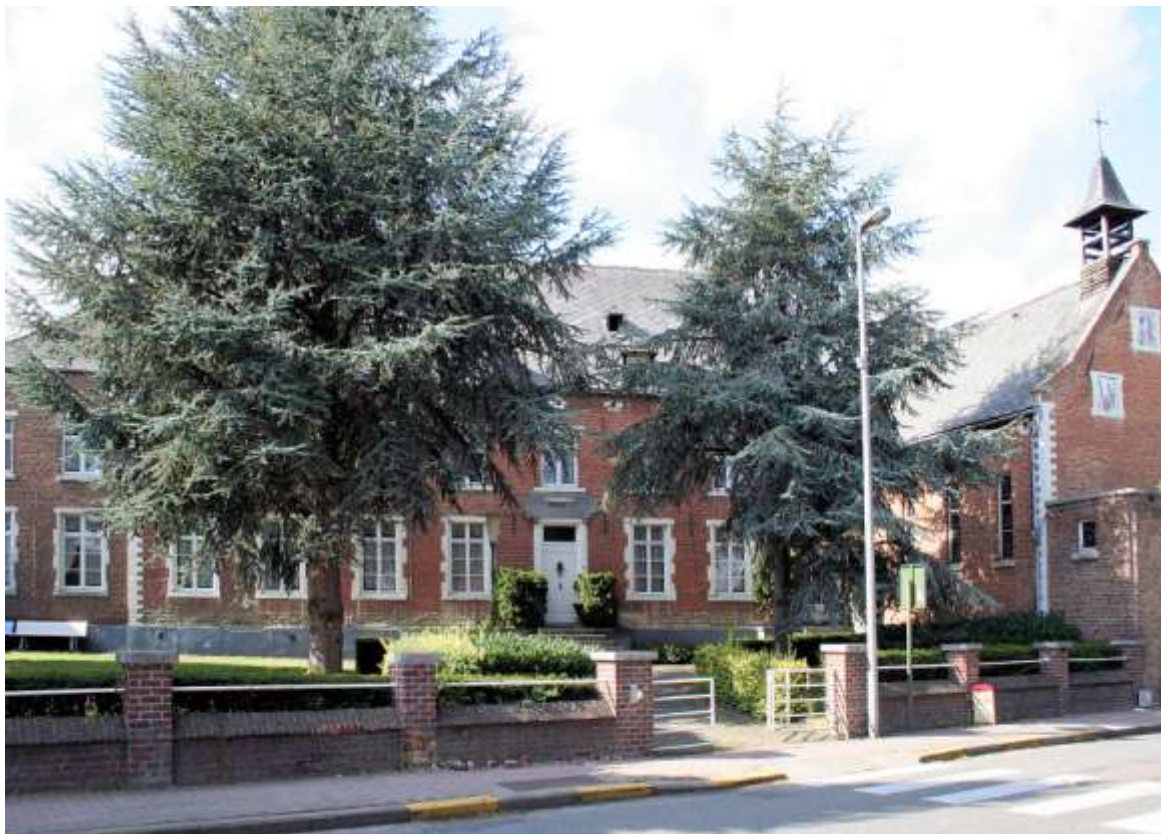
Het Sint-Jozefruithuis aan de Tiensestraat