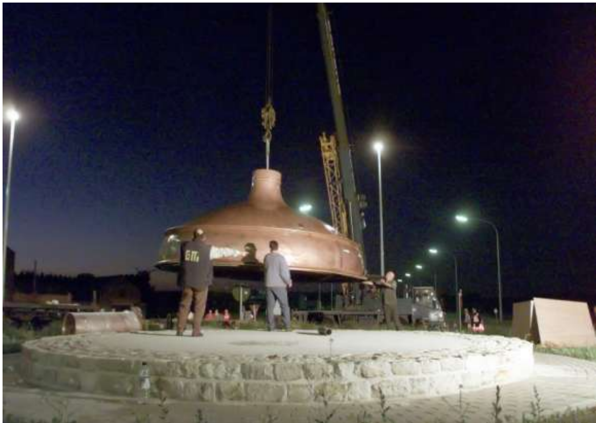
De brouwketel zal in juni 2000 geplaatst worden

TOCH BROUWKETEL – Er zou nu toch een brouwketel komen op de nieuwe rotonde in Altenaken. Het wordt een verlichte ketel die bijna geheel