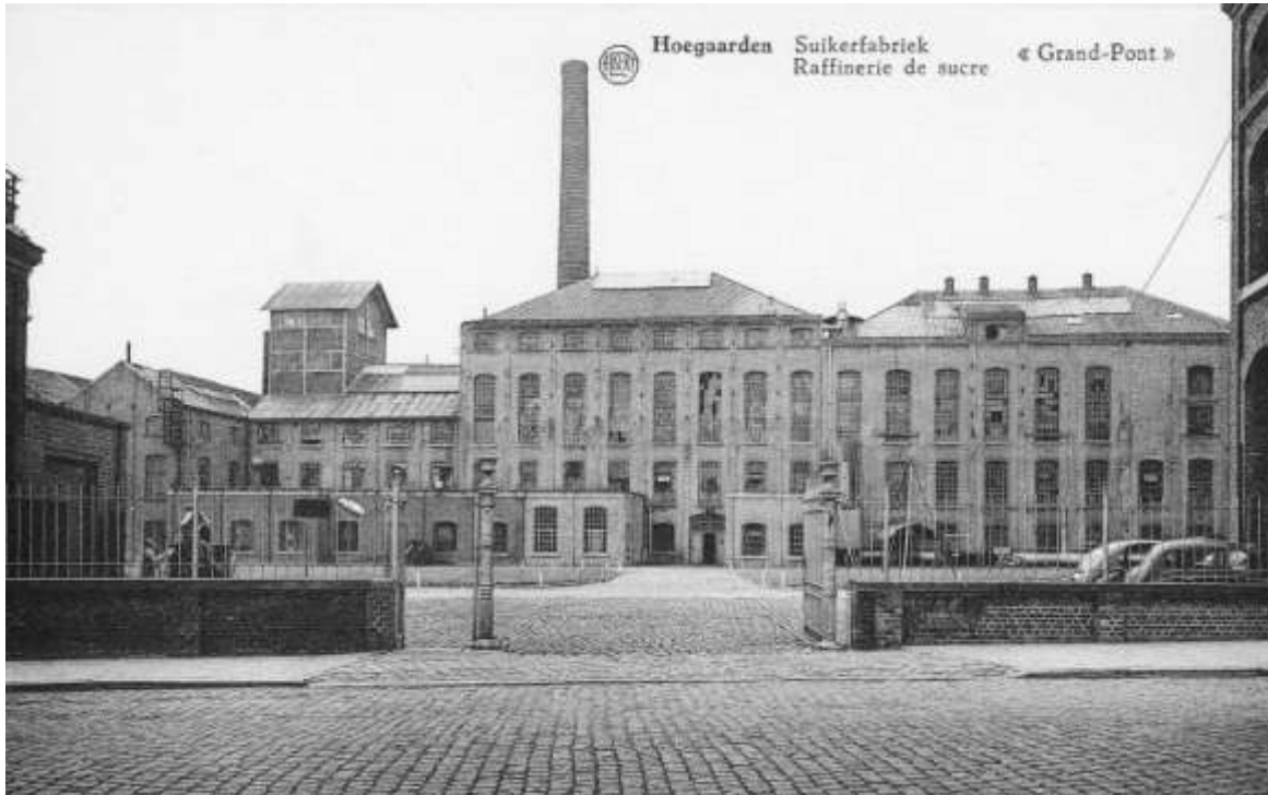
De suikerfabriek La Ghète, hier nog Grand-Pont genoemd, maar in wezen ging het om dezelfde firma na de overname door de Grand-Pont