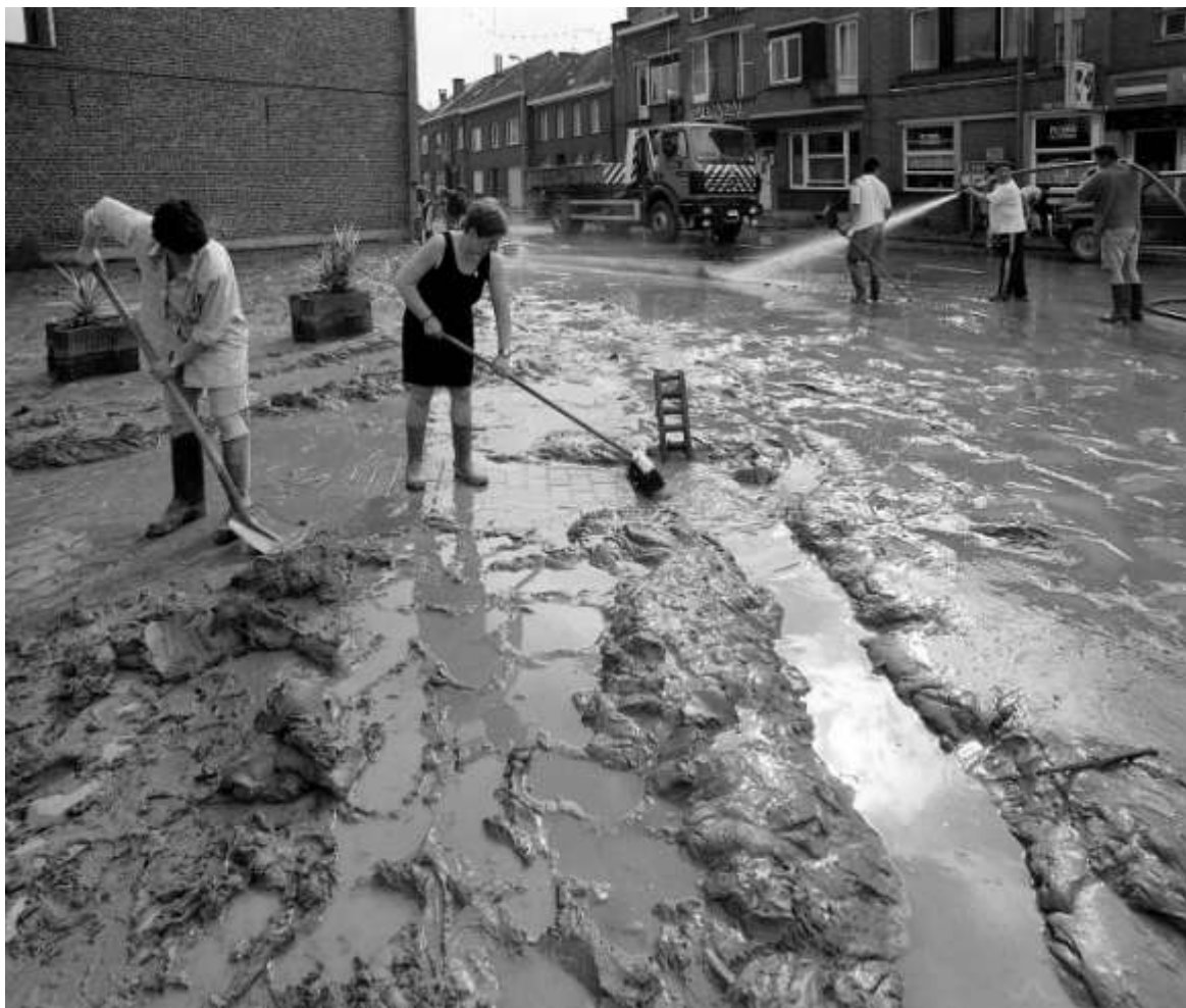
Er was ook modder in overvloed aan de Tiensestraat

TOCH MAATJES – Met een week vertraging worden de nieuwe maatjes toch in primeur