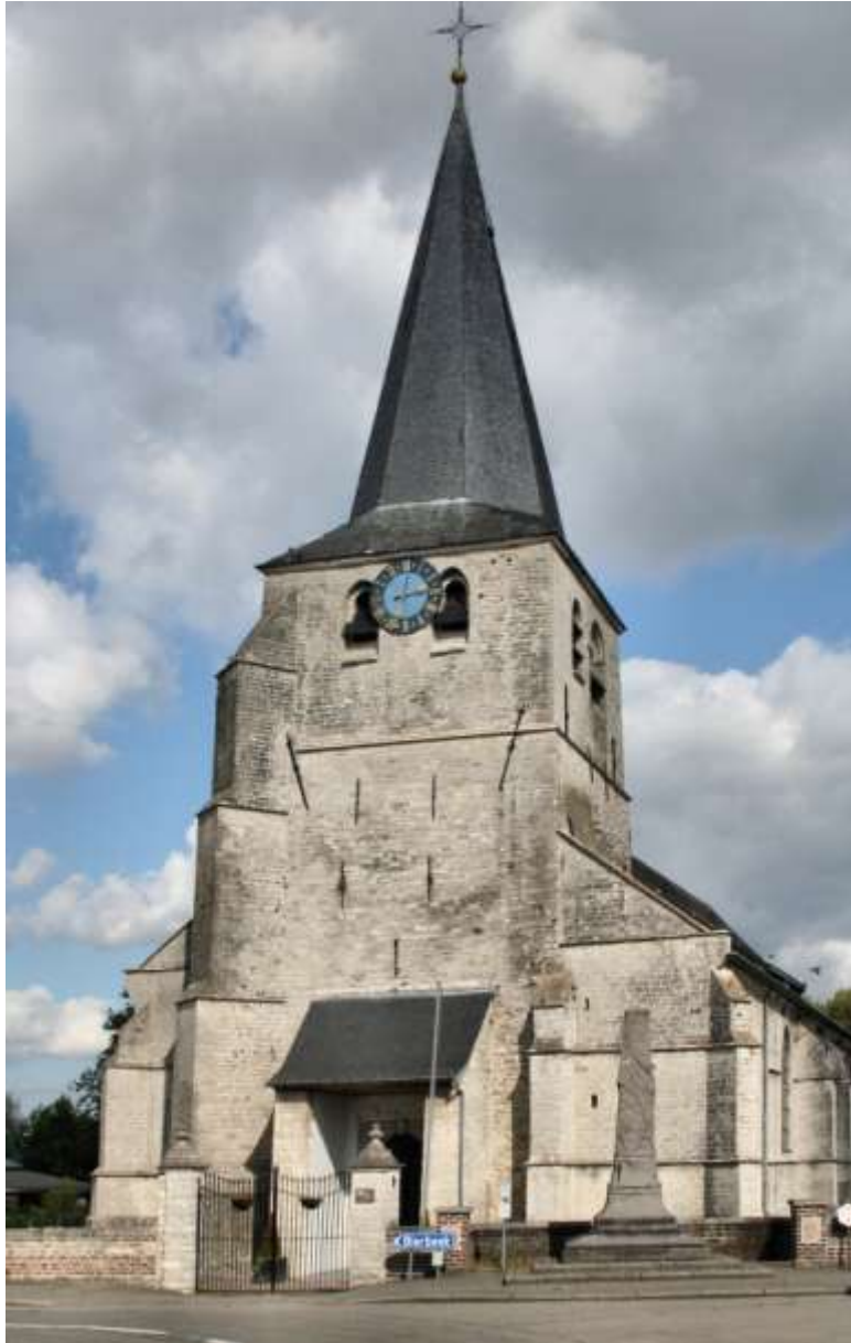
De Sint-Ermelindiskerk van Meldert