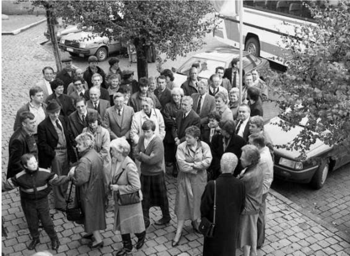
Ontvangst van de 1000 ste toeristische groep in Hoegaarden