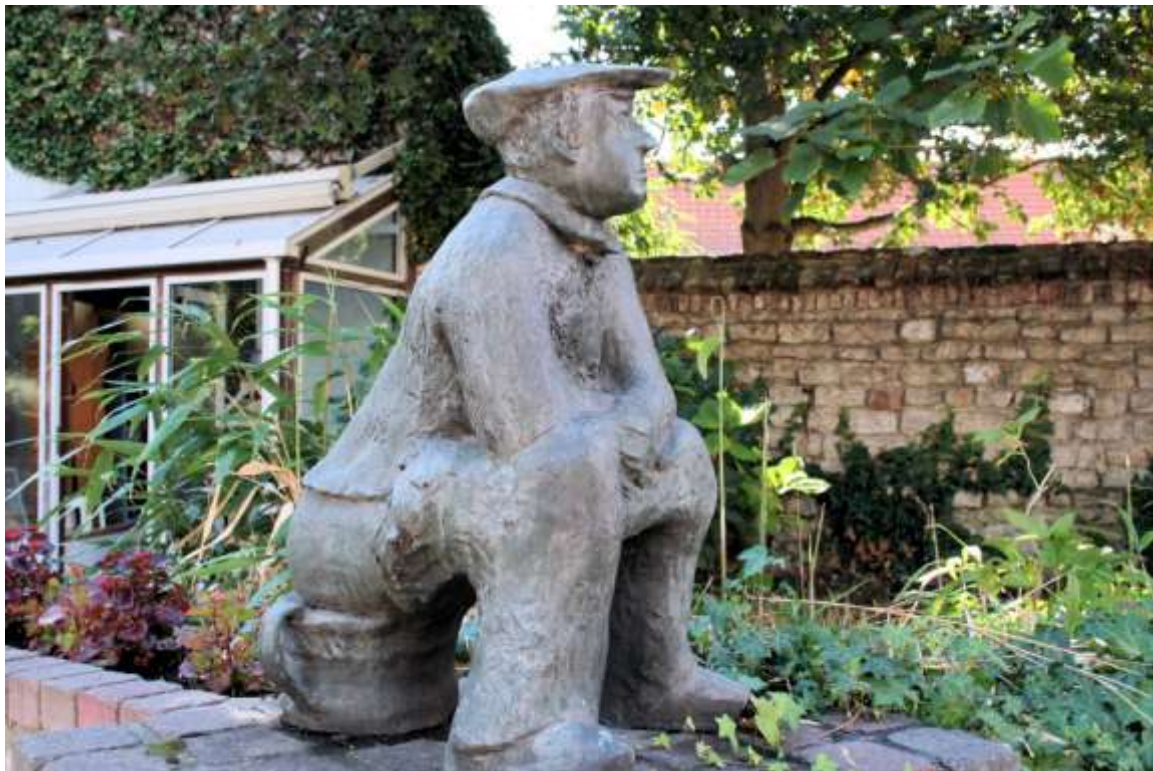
De Pikke Stijkès van Hoegaarden aan de Doelstraat