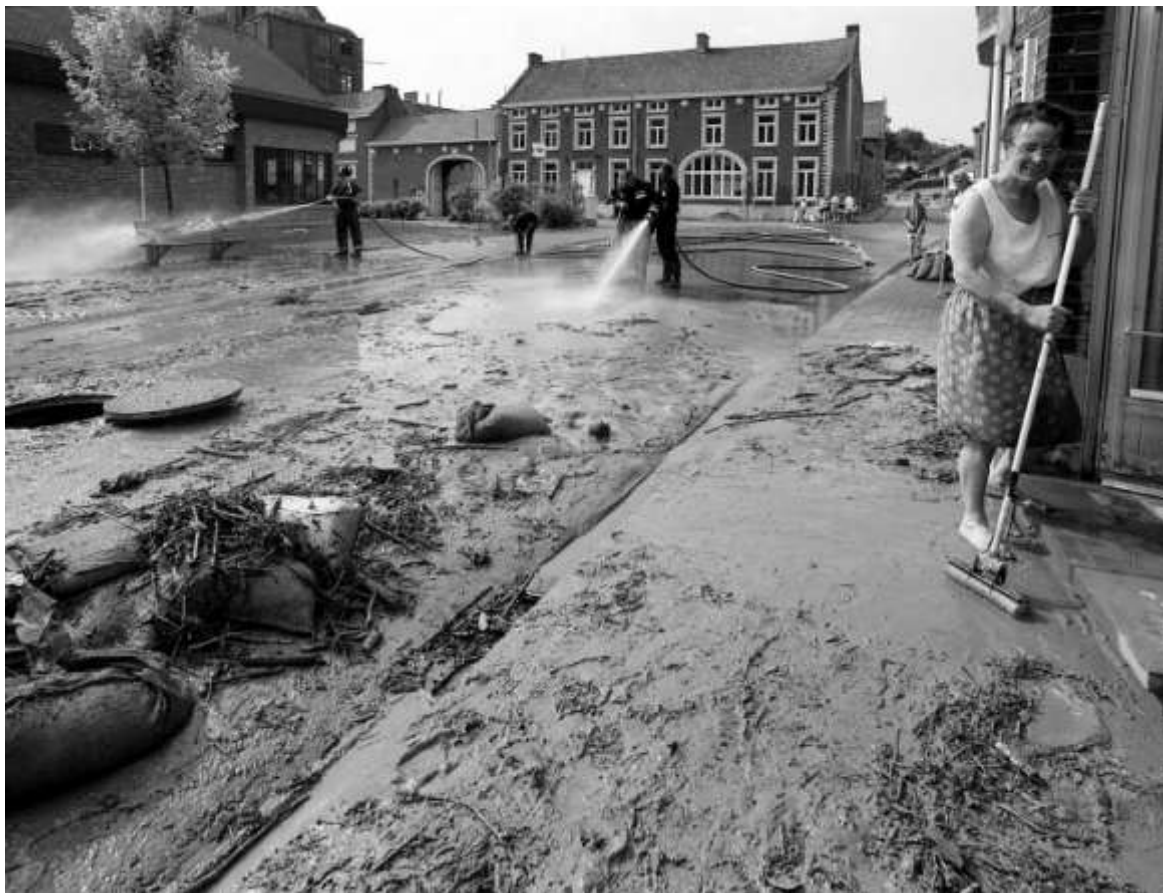
Wolkbreuk en modderoverlast aan de Gasthuisstraat

GRAND-PONT – Op de 40 ha grote bedrijfsterreinen in Altenaken heeft de brouwerij van