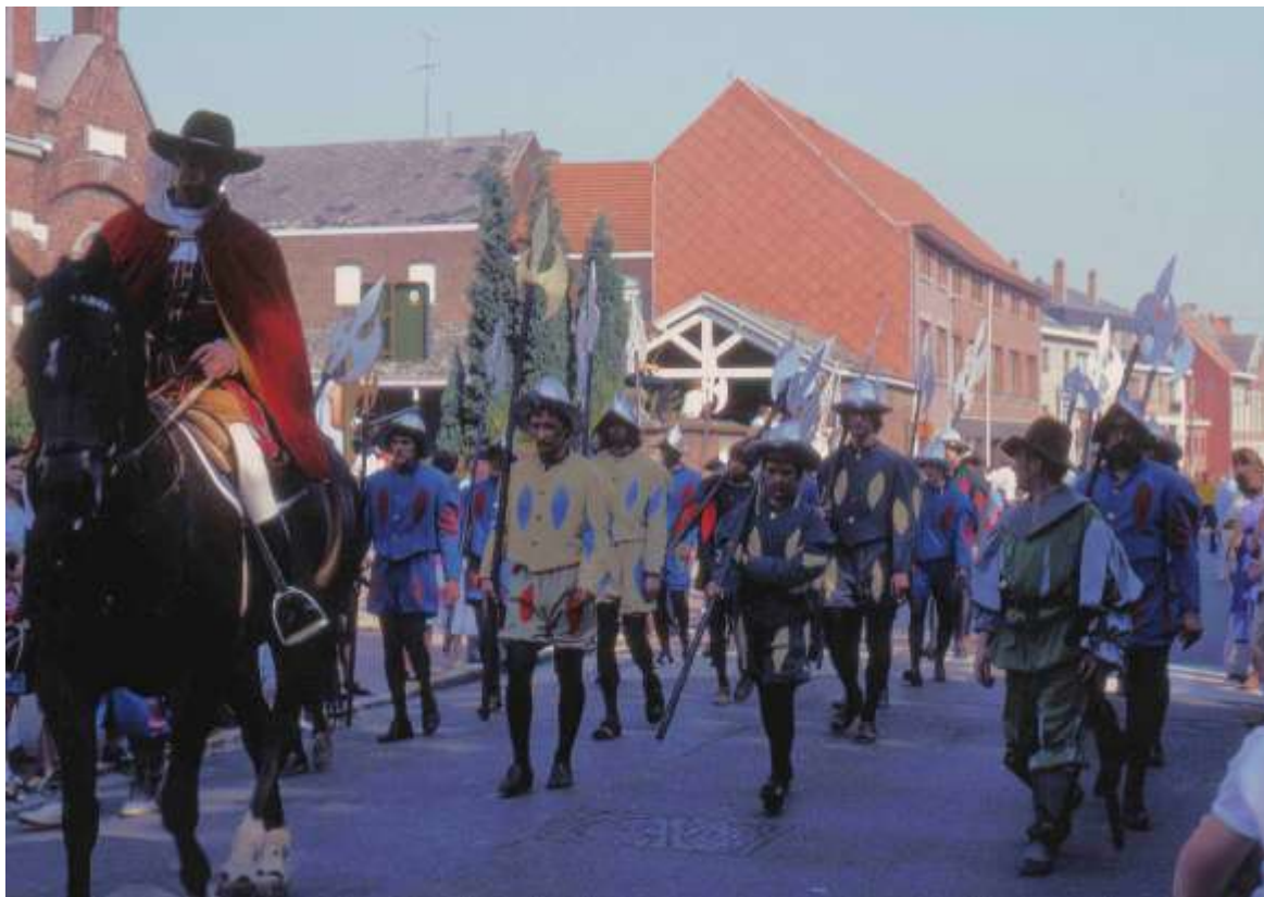
De geschiedenis van Hoegaarden wordt uitgebeeld tijdens de stoet