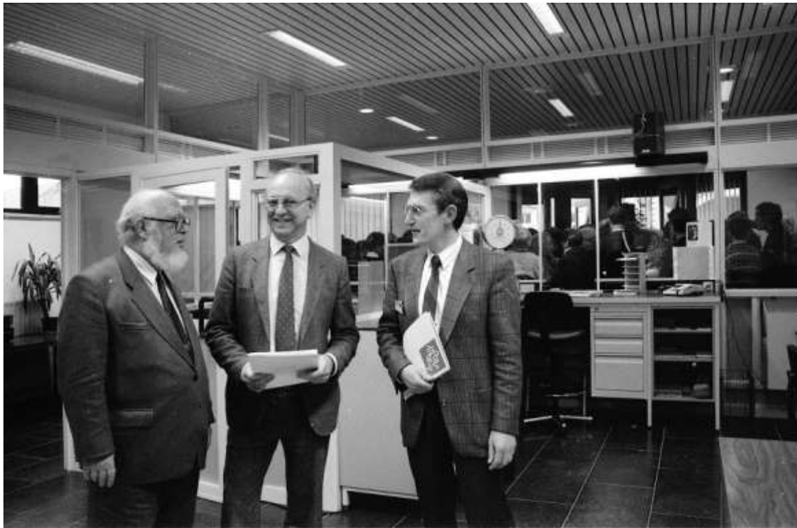
Het nieuwe postkantoor wordt ingehuldigd

NAAR HET PALEIS? – Museum 't Nieuwhuys heeft zich bij de 60/40 viering van Koning Boudewijn bijzonder ingezet, en hoopt met een groep kinderen van het 2 de leerjaar van de gemeenteschool, naar het paleis te kunnen gaan. De kinderen zullen daar tekeningen afgeven.