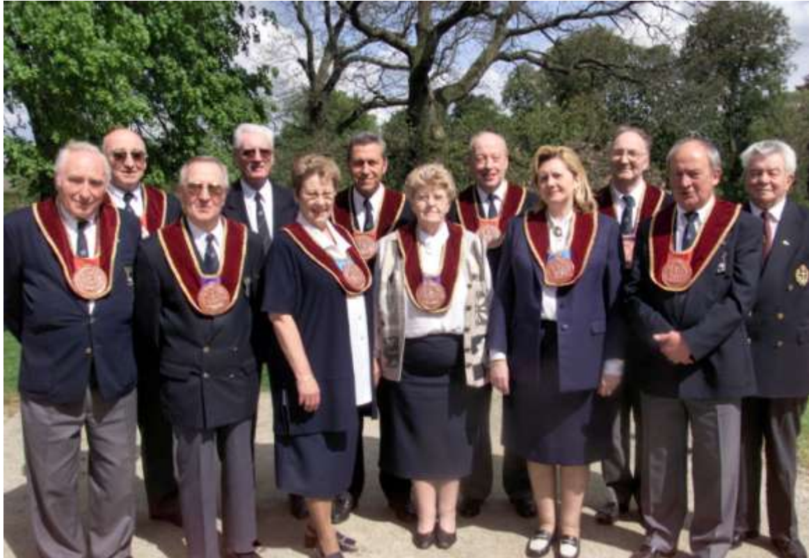
Viering 30 jaar Edele Orde vanden Moutstock