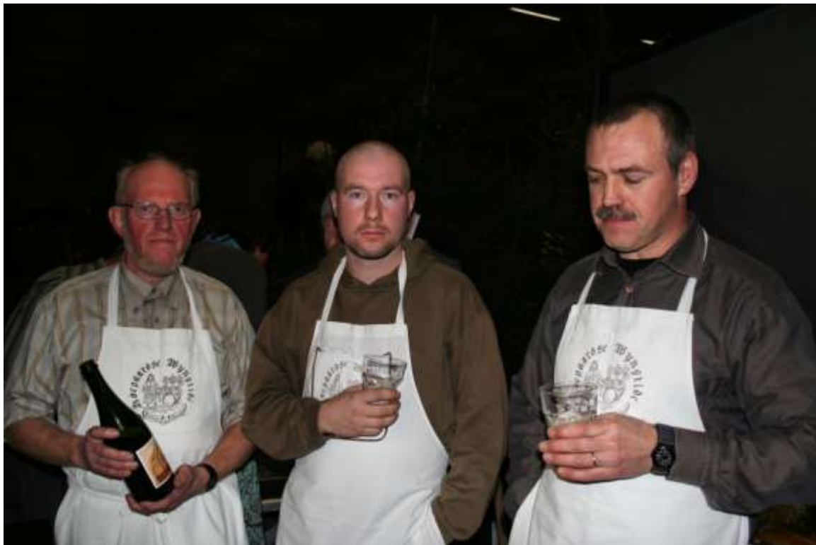
De Wijngilde maakt witbier voor de Pierre Celis viering