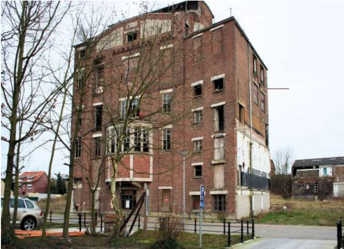
De oude toren van Lories