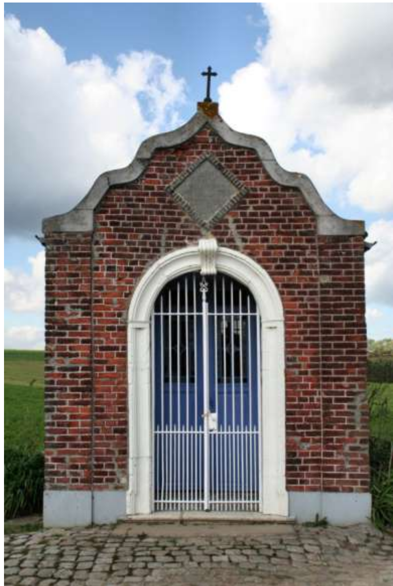
Het Lourdeskapelletje aan de Doornestraat in Hoxem

WIERLERTOERISTEN 20 JAAR – De wielertoeristen van de Klup vieren hun 20 ste verjaardag. Officieel werd gestart op 29 april 1973. De vereniging,