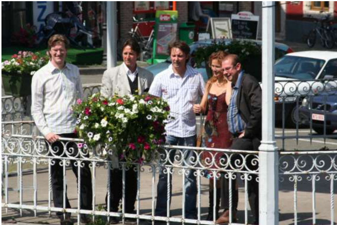
De organisatoren van Voices @ Hoegaarden

stemmen samen brengt: Voices was geboren”, aldus de initiatiefnemers. Voices @ Hoegaarden combineert op zaterdag 23 juni een brouwerijbezoek met landschapswandelingen en een fietstocht. Vanaf 14 uur doen woordkunstenaars hun ding aan vier gerestaureerde monumenten. Alle optredens 's avonds