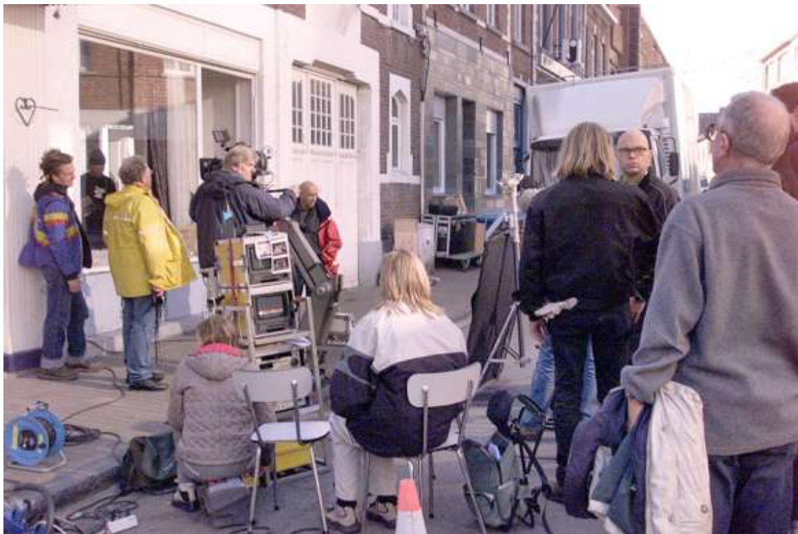
In de Doelstraat wordt een reclamespotje voor witbier opgenomen