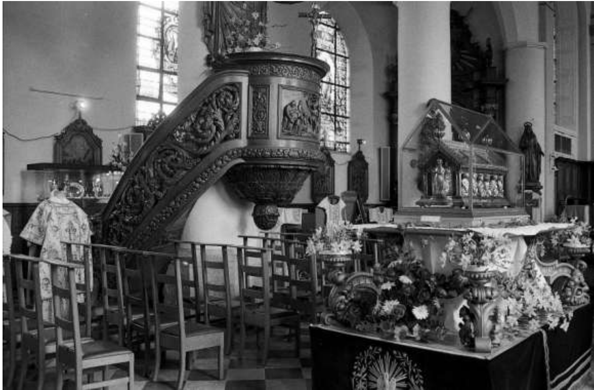
Het schrijn van Amiens in de kerk van Meldert

men, zuileiken, moerascypresen ... blijven hiervan over. Het terrein rond de twee langgerekte vijvers bleef lange tijd open en het is pas 30 jaar geleden dat het werd beplant met Canadapopulieren. In 1911 werd op de oudere 19 de eeuwse parkaanleg,