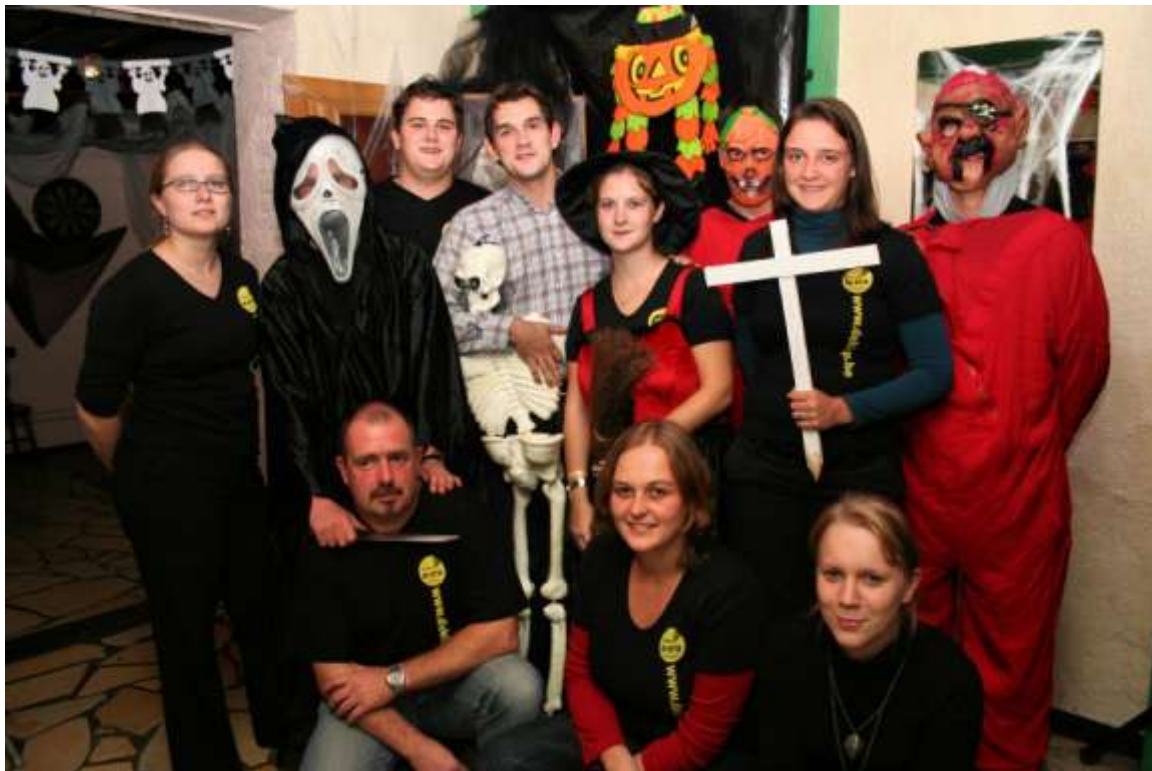
De organisatoren die circa 5000 deelnemers naar de Halloweenocht haalden

LES TRUTTES OP 10 de HALLOWEENTOCHT BIJ DE KLUP - De tiende Halloweenocht van de Klup werd een groot populair succes, met 3000 ingeschreven wandelaars. Maar het laatste uur werden nog ruim 1500 mensen het veld ingelaten zonder inschrijving, zodat er ongeveer 5000 nachtelijke wandelaars in het veld zaten. De Halloweenocht zelf viel wat tegen, maar het