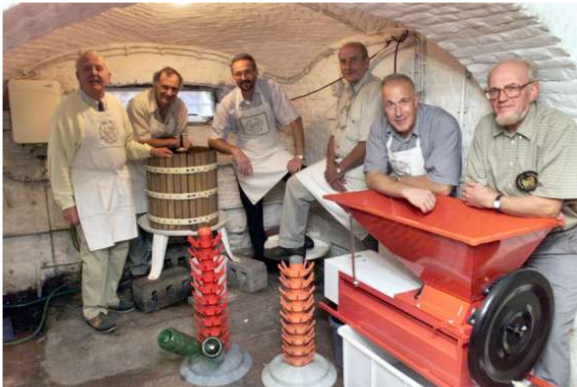
De Hoegaardse Wijngilde viert zijn 25 ste verjaardag

AANDELEN IN CV HUISVESTING – De gemeente Hoegaarden neemt twee aandelen over van het OCMW Tienen in de CV Huisvesting Tienen, in de hoop dat de huisvestingsmaatschappij in de toekomst ook in Hoegaarden sociale woningen gaat realiseren. Dit blijkt ook in de andere gemeenten rond Tienen een probleem te zijn, o.a. in Glabbeek.