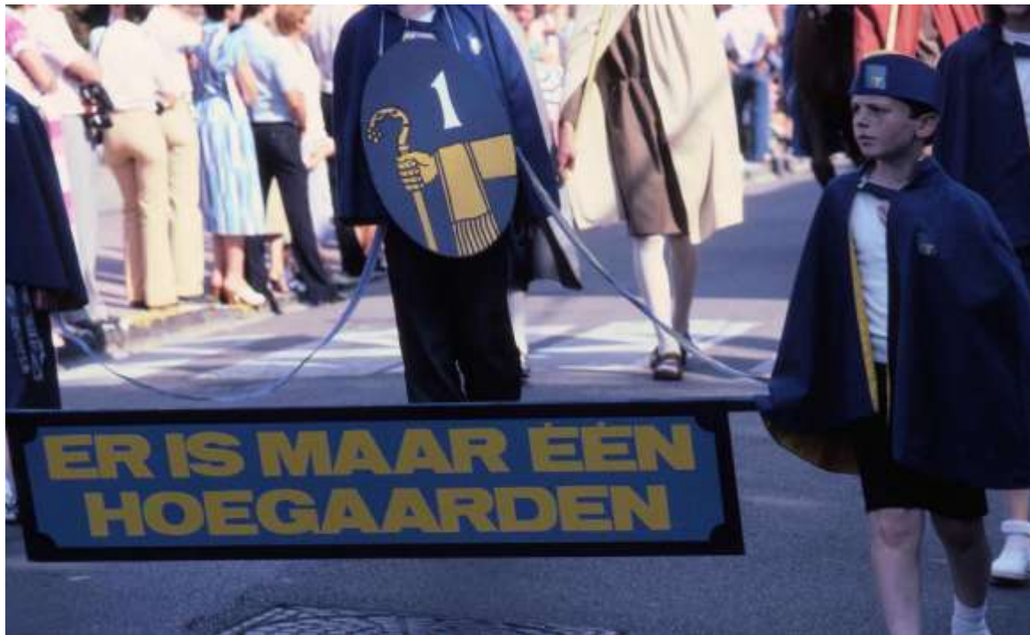
Er is maar één Hoegaarden wordt het motto van de Millenniumstoei

SINT-ROCHUSKAPEL – De gemeenteraad keurt het ontwerp tot herstel van het interieur van de Sint-Rochuskapel in Mariadal goed. De kosten worden geraamd op 1,1 miljoen frank.