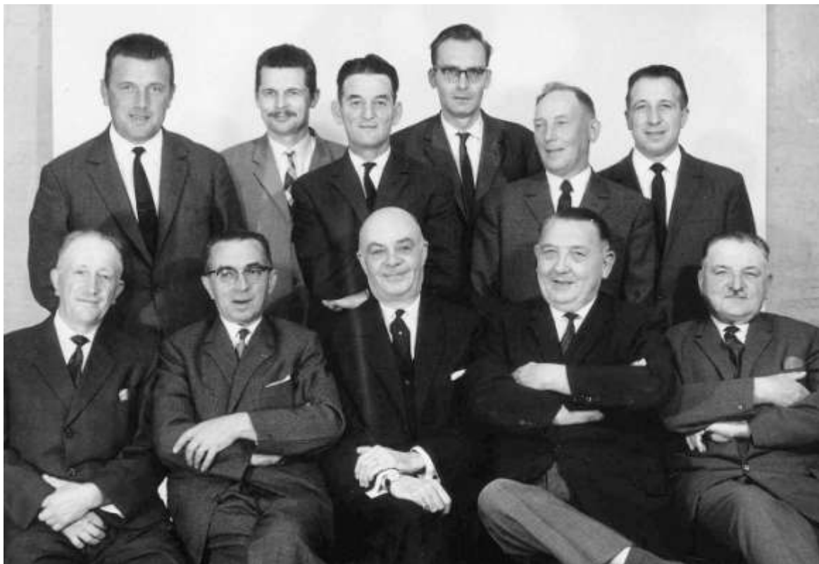
De liberale partij in 1964

de Sint-Gorgoniuskerk wordt centrale verwarming aangelegd.