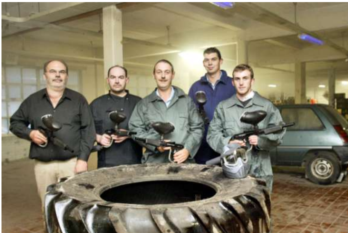
De nieuwe paintballhal wordt voorgesteld in de Polder