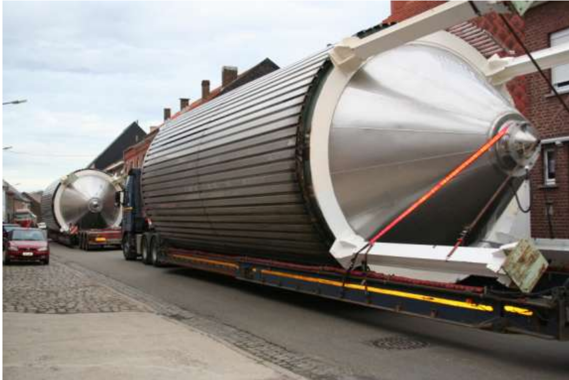
De gistingstanks verhuizen naar Jupille

men begin december in Altenaken starten met het bottelen en verpakken. Er zullen nog 69 mensen tewerkgesteld worden. De oude vatenlijn van de Kluis is nog in gebruik, maar de nieuwe vatenlijn verhuisde al naar Jupille.