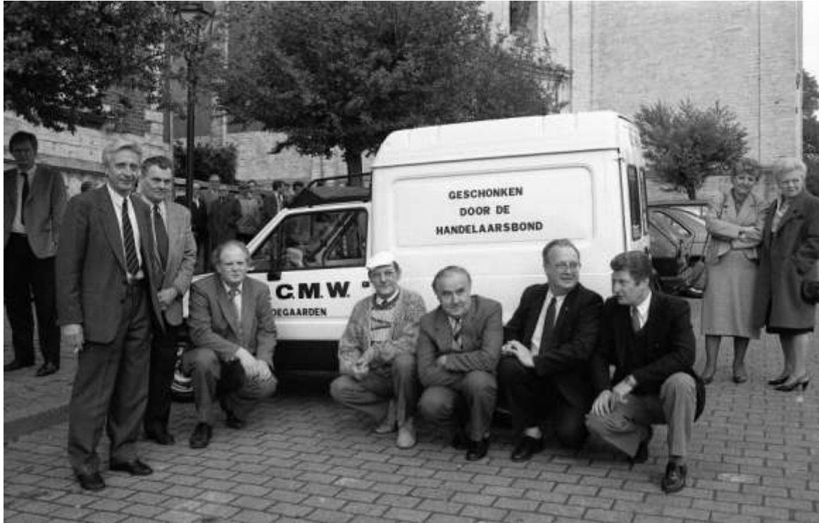
De Handelaarsbond overhandigt de bestelwagen aan het OCMW

GOLFBILJARTCLUB HHM BESTE – Hand in Hand Meldert heeft zich opgewerkt tot de beste golfbiljartclub in