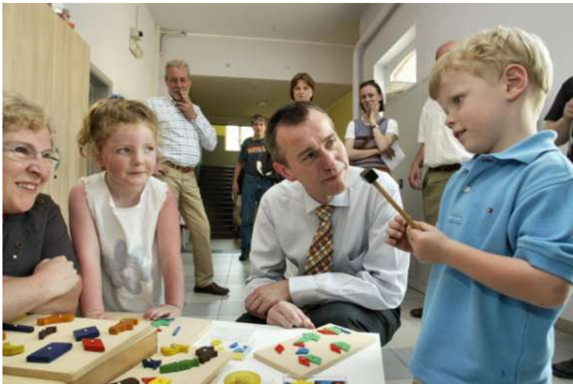
Vlaams Minister van Onderwijs Frank Vandenbroucke in Mariadal

MINISTER IN MARIADAL – Vlaams Minister van Onderwijs Frank Vandenbroucke brengt een bezoek aan Mariadal. Volgens de minister berust het gevoel dat hij het buitengewone