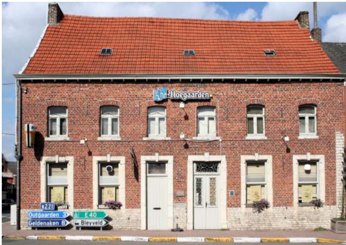
Het Nieuwhuys had vele functies in de geschiedenis, o.a. gemeentehuis