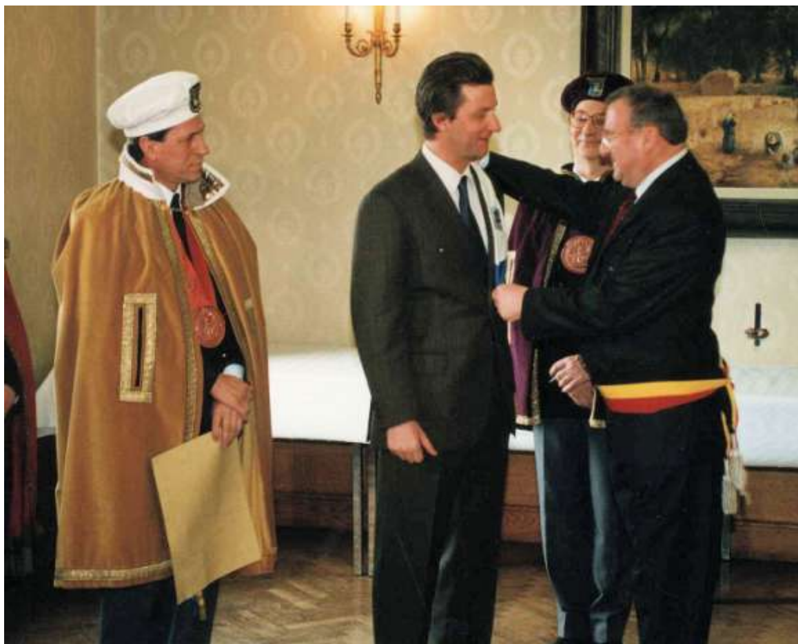
Prins Filip wordt ontvangen op het gemeentehuis

BEGROTING MET WINST – De gemeentebegroting wordt