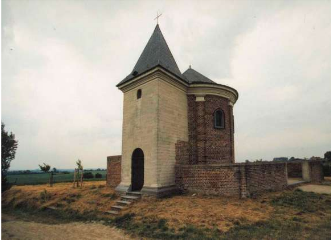
De marollenkapel is pas gerestaureerd

nisatie overgegaan na WOII en het gebruik van meststoffen werd toen door de overheid sterk gepromoot. De overheid heeft dus gezorgd voor overproductie. De landbouwers hebben hun bezwaren overgemaakt aan het schepencollege en vragen dat de industrie meer gecontroleerd wordt.