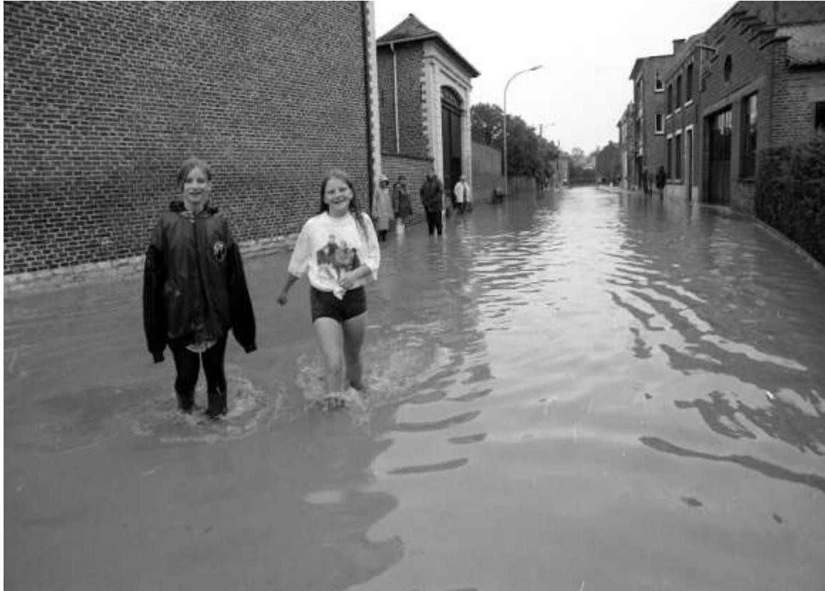
Sommigen proberen er bij de overstromingen nog het beste van te maken

ziek betreft gitaar, basgitaar, keyboard, drums en percussie. Er wordt ook afrodans en jazz dance georganiseerd. Mensen kunnen zich ook creatief uitleven in een cursus papierschepen en keramiek.