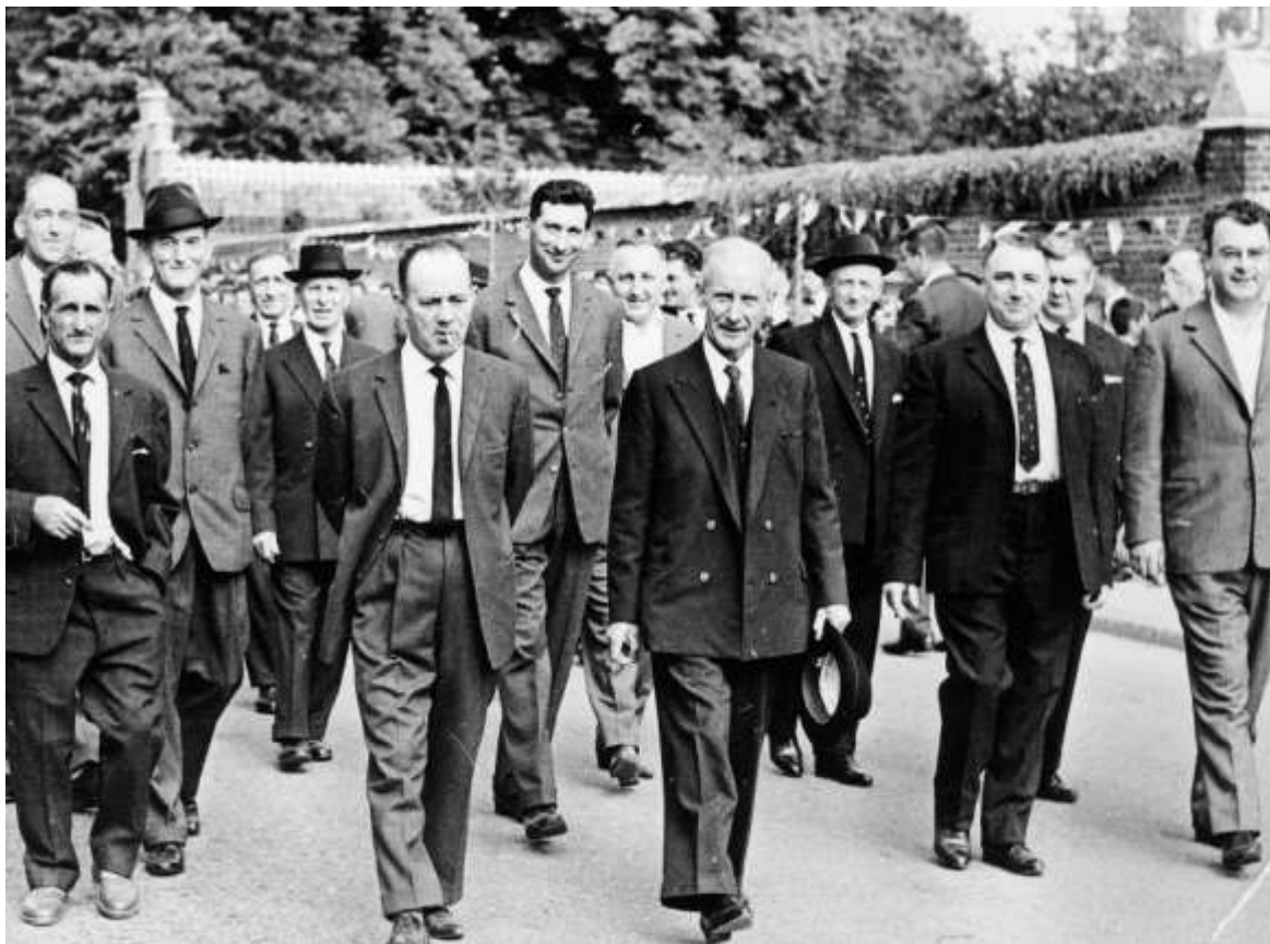
De organisatoren van de stoet van Bare Bessem uit Overlaar

LAATSTE TREIN - De lijn 142 liep van Tienen naar Namen, en kwam uiteraard in Hoegaarden voorbij. Het stuk Ramillies-Tienen werd geopend op 6 juni 1867, het stuk Ramillies - Namen in 1869. Al deze lijnen waren aangelegd met enkelspoor. Deze in 1871 door de Staat overgenomen lijn was