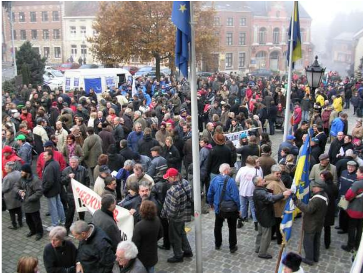
Een massa volk is klaar voor de Stille Optocht op het Gemeenteplein